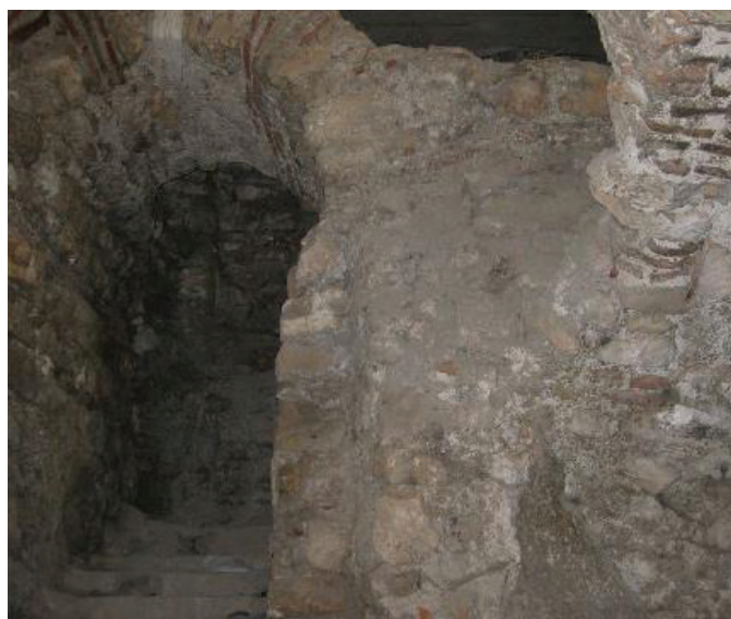
קמרון במרתפי הניאה

סיבה נוספת לבנייתה של הכנסיה הייתה רצונו של יוסטיניאנוס לשחזר את יופיו והדרו של בית המקדש השני שנבנה בהר הבית ואף להאפיל עליו, ולהמחיש כך את עליונותה של הנצרות על פני היהדות 5 . על סמך מקורות הטוענים כי יוסטיניאנוס הורה להחזיר לירושלים את אוצרות בית המקדש שנבזזו בעת החרבתו, יש הסבורים שאותם אוצרות הוצבו בכנסיה וחפירות נוספות במרתפיה עשויים לגלות אותם 6 . נטען אף כי יוסטיניאנוס הורה להשתמש בכל עמודיו של בית המקדש החרב בבנייתה של הכנסיה 7 .