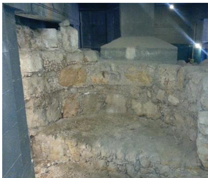
האפסיס - כיום נמצא בשטח בית הספר ממ"ד שברובע היהודי