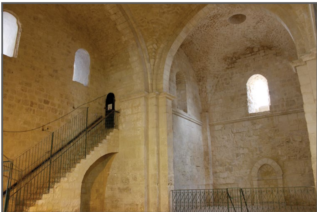
פנים המסגד אחרי שיפוץ