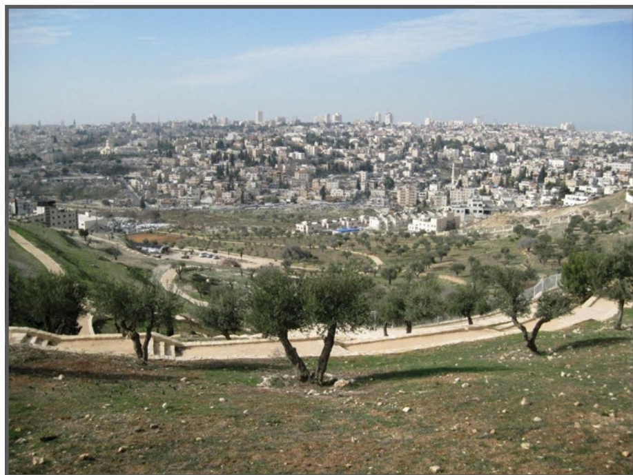
עמק צורים - מבט לדרום-מערב - השכונות הפלסטיניות ובאופק הישראלי