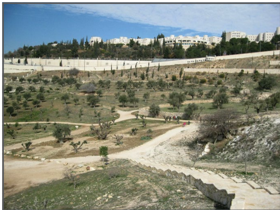
עמק צורים והאוניברסיטה העברית