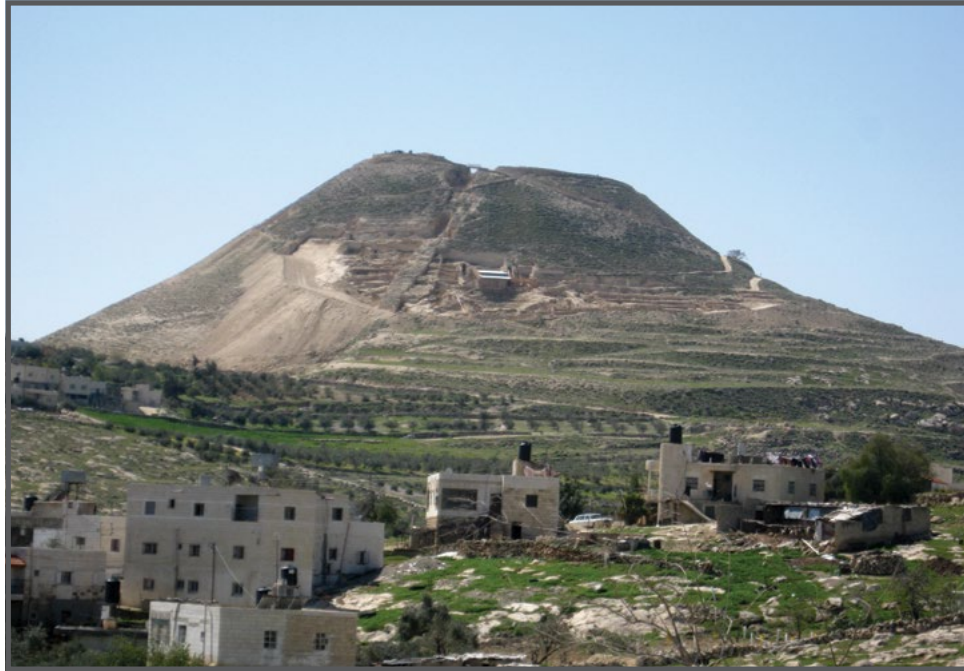
הרודיון והכפר זעתרא