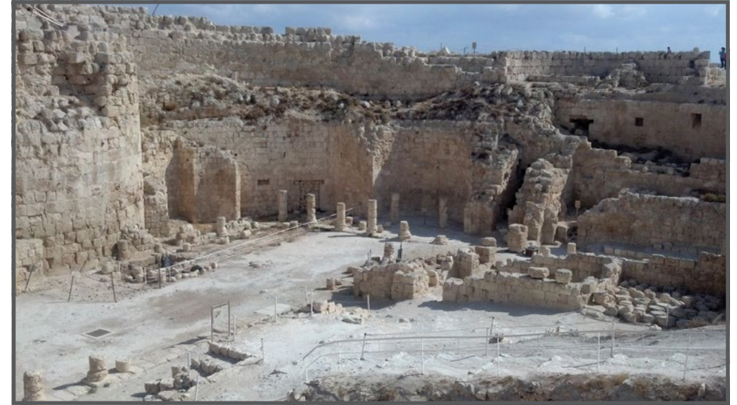
הרודיון - המבצר והארמון העליון

מסמך זה עוסק במערכת החוקים בישראל ובגדה המערבית הנוגעת לגנים לאומיים ופארקים, ומציג מספר גנים לאומיים בגדה המערבית ובמזרח ירושלים המשפיעים באופן מכריע על חיי הפלסטינים שחיים בתוכם או בקרבתם.