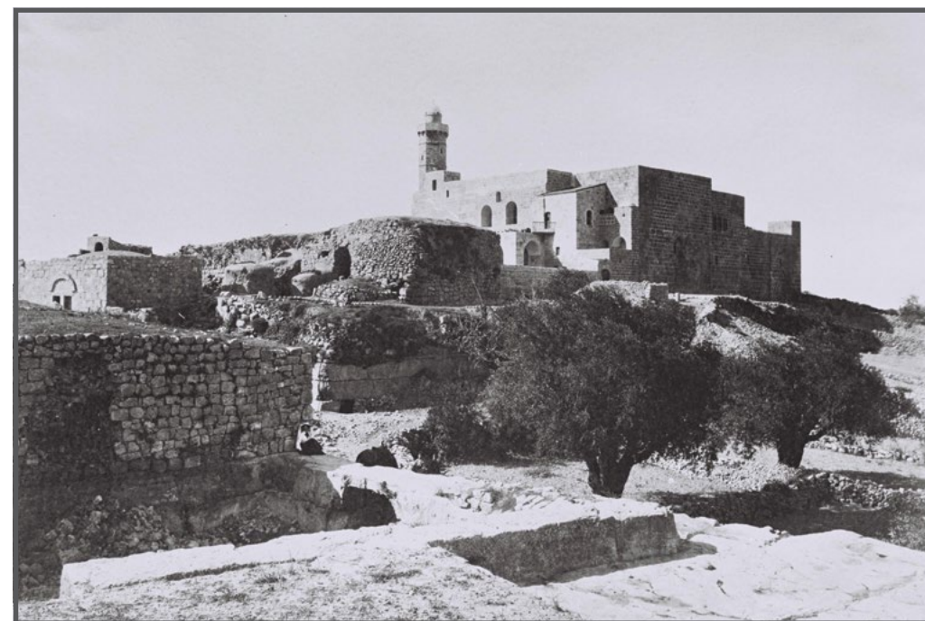
נבי סמואל - צילום משנת 1910

אופן הצגת האתר: בשנות ה-50 וה-60 של המאה ה-20 התקיימו בהרודיון חפירות ארכיאולוגיות על ידי בית הספר הפרנציסקני למקרא, ומשנת 1980 ואילך נעשו החפירות בידי האוניברסיטה העברית. החפירות מתמקדות בחשיפת שרידים מתקופת מלכותו של הורדוס. 12 גם הגן הלאומי מתמקד בהצגת השרידים מתקופה זו. 13 למרות חשיבותה של הצגתם של שרידים אלה, יש טעם לפגם בבחירה להתמקד בהם בלבד. בחירה זו מצמצמת את יכולתו של המבקר להכיר את מגוון השאלות העולות מהמחקר הארכיאולוגי. לצד שרידי התקופה ההרודיאנית, ניתן היה להציג לציבור את שרידי התיישבות הנזירים בתקופה הביזנטית, המתארים תופעה מרתקת וייחודית שמעסיקה מחקרים רבים. אך כאמור, שרידים אלה מוסתרים מעין הציבור הישראלי.