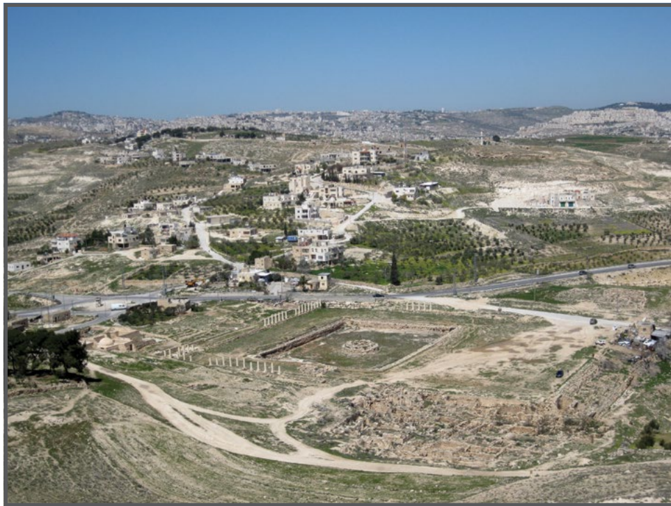
הרודיון תחתית והכפר זעתרא

היחס לאוכלוסייה הפלסטינית: סביב האתר הרודיון שוכנים מספר כפרים פלסטיניים: פורדיס, זעתרא, ג'יב אל-דיב, בית עמאר ועוד. לכל הכפרים הללו ישנן אדמות ואף בתים בשטח הפארק. בעלי האדמות והבתים ששטחם מוכרז כפארק אינם יכולים לעבד את אדמותיהם ואף לא לשפץ את בתיהם ללא אישור קצין שמורות טבע והפארקים במנהל האזרחי. איסור זה חל על שיפוץ פנים הבית ואף על תיקון התקרה למניעת נזילות. מדיניות אישור עיבוד האדמה אינה ברורה לתושבים: חלקם זכאים להמשיך לעבד את אדמותיהם ועל אחרים העיבוד נאסר. בגן הלאומי ישנם שלטים רבים המכוונים את המבקרים למסעדות, מקומות לינה ואטרקציות נוספות, וכל כולן ממוקמות בהתנחלויות הסמוכות. באתר אין עובדים פלסטינים.