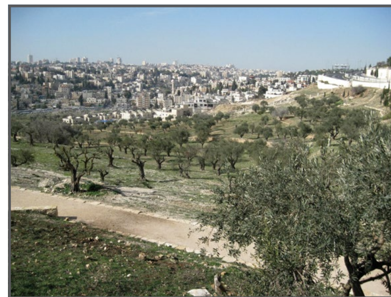
עמק צורים ושכונת ואדי ג'וז

■ העדר שטחים ציבוריים ואפשרות לפעילות פנאי ותרבות: מרחבים עירוניים בישראל ובעולם כוללים שטחים ומבנים המשמשים מוקדי תרבות, ספורט וביילוי. בשכונות מערב ירושלים קיימים מתנ"סים, גני שעשועים, מגרשי ספורט, אולמות קולנוע ותיאטרון, בריכות ועוד. ההכרזה על הגן הלאומי עמק צורים גזלה את מעט השטחים הציבוריים שנותרו בשכונה. בקרבת הגן הלאומי נמצא מגרש משחקים ששימש את תלמידי בית הספר הסמוך ואת תושבי השכונה, אך בשנת 2011 ניהלה רשות הטבע והגנים מאבק נגד פעילותו, בתואנה לפגיעה בגן הלאומי. רט"ג הרסה את הגדר שהקיפה את המגרש מספר פעמים וחדלה לעשות זאת רק לאחר שהוכח בבג"ץ כי המגרש אינו נמצא בשטח הגן הלאומי. 15 לשם ההשוואה, בשכונת ימין משה, שנמצאת בתוך הגן הלאומי סובב חומות ירושלים, אפשרו בניית מוזיאון ואושרה הרחבתו של סינמטק ירושלים.