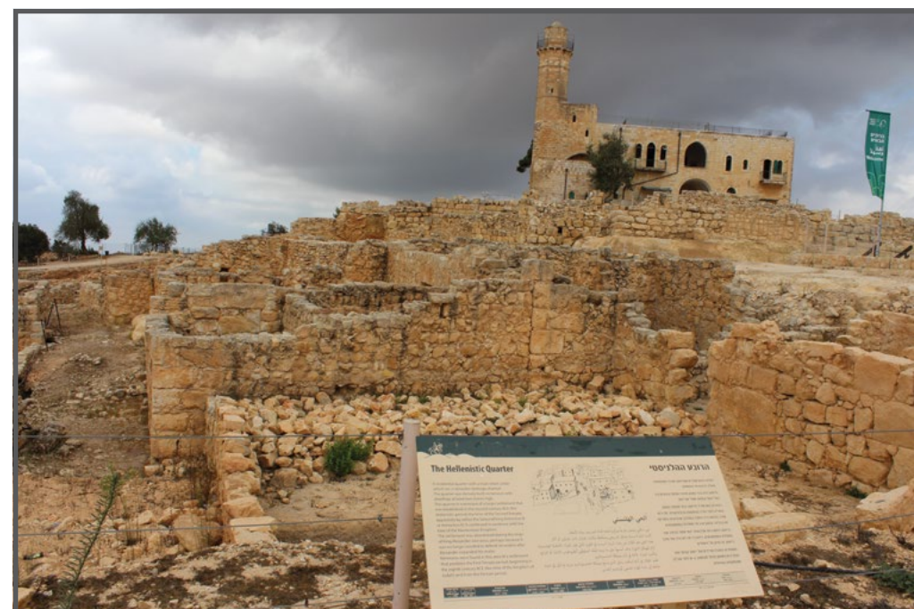
נבי סמואל - האתר התיירותי כיום