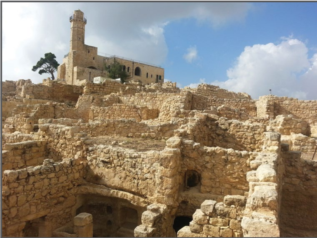
נבי סמואל ושרידי הכפר נבי סמואל

הגן הלאומי פוגע גם בזכות לחופש פולחן דתי. על פי החוק לשמירה על מקומות קדושים (סעיף 1), על רשות הטבע והגנים להתיר לתושבי הכפר גישה חופשית למסגד הנמצא בשטח האתר. תושבי הכפר מתפללים במסגד, אך מאז הקמת גדר ההפרדה בין נבי סמואל לכפרים אל-ג'יב וביר נבאלה, ניכרת ירידה חדה במספר המתפללים. ללא אישור בידם, תושבי הכפרים שמעבר לגדר מנועים מלהגיע לכפר. בה בעת השקיע המשרד לענייני דת 7 מיליון ש"ח בשיפוץ ובהכשרתן של תשתיות למבקרים בקבר הנביא סמואל. רוב ההשקעה נועדה להגביר את ביקורי היהודים במקום, 9 במועדים כימי הילולת הנביא סמואל, המתקיימת במהלך חודש מאי (בהתאם ללוח השנה העברי). במהלך שלושת ימי הילולה הכפר סגור לפלסטינים שאינם תושבי המקום, ותושביו נאלצים לתאם כל כניסה ויציאה משם עם המנהל האזרחי. 10