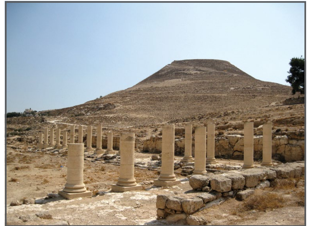
הרודיון - מבט מהרודיון תחתית

היחס לאוכלוסייה הפלסטינית: סביב האתר הרודיון שוכנים מספר כפרים פלסטיניים: פורדיס, זעתרא, ג'יב אל-דיב, בית עמאר ועוד. לכל הכפרים הללו ישנן אדמות ואף בתים בשטח הפארק. בעלי האדמות והבתים ששטחם מוכרז כפארק אינם יכולים לעבד את אדמותיהם ואף לא לשפץ את בתיהם ללא אישור קצין שמורות טבע והפארקים במנהל האזרחי. איסור זה חל על שיפוץ פנים הבית ואף על תיקון התקרה למניעת נזילות. מדיניות אישור עיבוד האדמה אינה ברורה לתושבים: חלקם זכאים להמשיך לעבד את אדמותיהם ועל אחרים העיבוד נאסר. בגן הלאומי ישנם שלטים רבים המכוונים את המבקרים למסעדות, מקומות לינה ואטרקציות נוספות, וכל כולן ממוקמות בהתנחלויות הסמוכות. באתר אין עובדים פלסטינים.