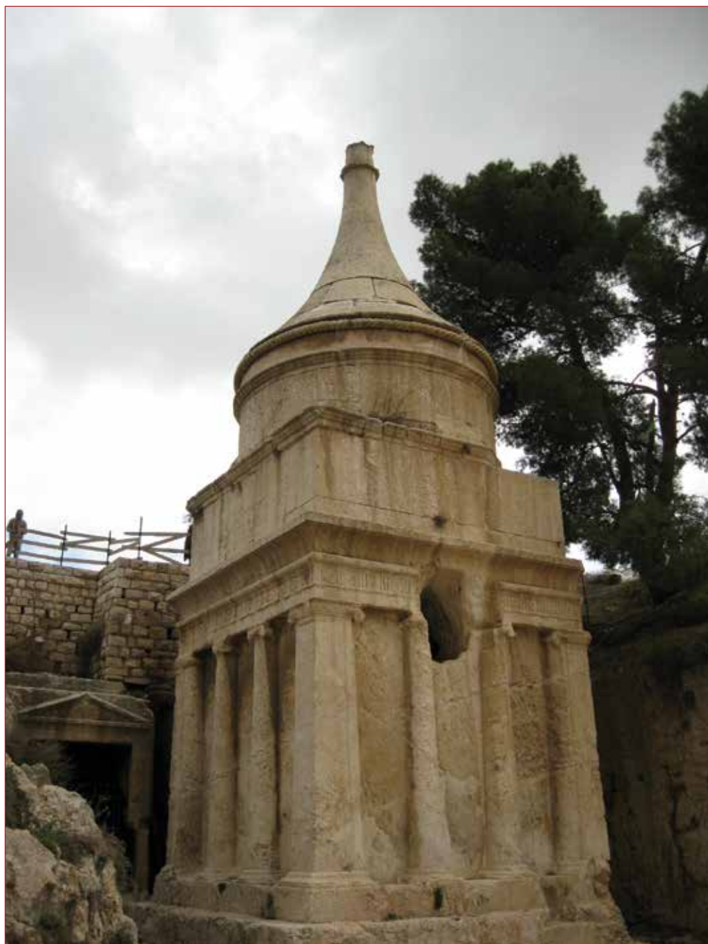
יד אבשלום שבנחל קדרון