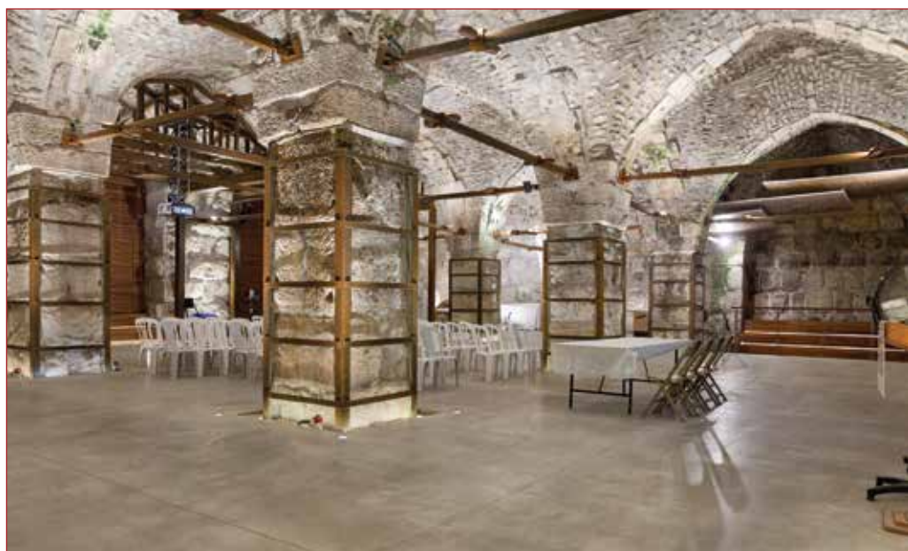
חלל תת קרקעי ברובע המוסלמי - חלק ממתחם אוהל יצחק