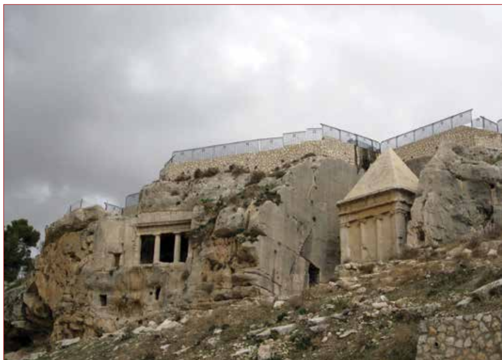
קבר זכריה ובני חזיר שבנחל קדרון