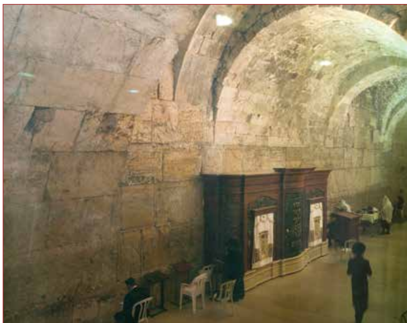
מתחם תפילה מתחת לקשת 'וילסון' בצמוד למנהרות הכותל

יודגש, כי הוראת ס' 29(ג) לחוק העתיקות (המחייב את אישורה של וועדת שרים כדי לבצע חפירה במקום קדוש), אינה דורשת כי מקום קדוש יהיה מוכר בחוק או בתקנות; לשון הסעיף מסתפקת בהגדרת אתר עתיקות כמקום "המשמש לצורך דתי או מוקדש לתכלית דתית". על פי ניסוח סעיף זה, לגבי כל בית קברות, קבר או בית תפילה, יש צורך בכינוס של ועדת השרים. כאמור, רשות העתיקות אינה מקיימת בירושלים את הוראת ס' 29(ג) לחוק העתיקות, הן בעניין המקומות המוכרים כקדושים בתקנות השמירה על מקומות קדושים ליהודים, והן בעניין המקומות שאינם מוכרים כקדושים בתקנות, אך משמשים לצורך דתי או מוקדשים לתכלית דתית. דוגמאות לכך מהעת האחרונה הן ההחלטה לבנות במרכז דוידסון רחבת תפילה בשטח של כ-900 מ"ר, כאשר כבר היום משמש חלק מהמקום לצורך דתי והרחבה תישק לכותל המערבי הדרומי ולהר הבית; התכנית של הקרן למורשת הכותל לבנייה ברחבת הכותל את 'בית הליבה' (תכנית מס' 11053), והתכנית של עמותת אלע"ד לבניית מרכז מבקרים, מרכז שיכלול את מעין מרים הקדוש לנוצרים וליהודים (תכנית מס' 13901). לא ידוע כי רשות העתיקות כינסה את הוועדה בעניין שלושת המקרים האלה ואם יש בכוונתה לכנס אותה בעתיד.