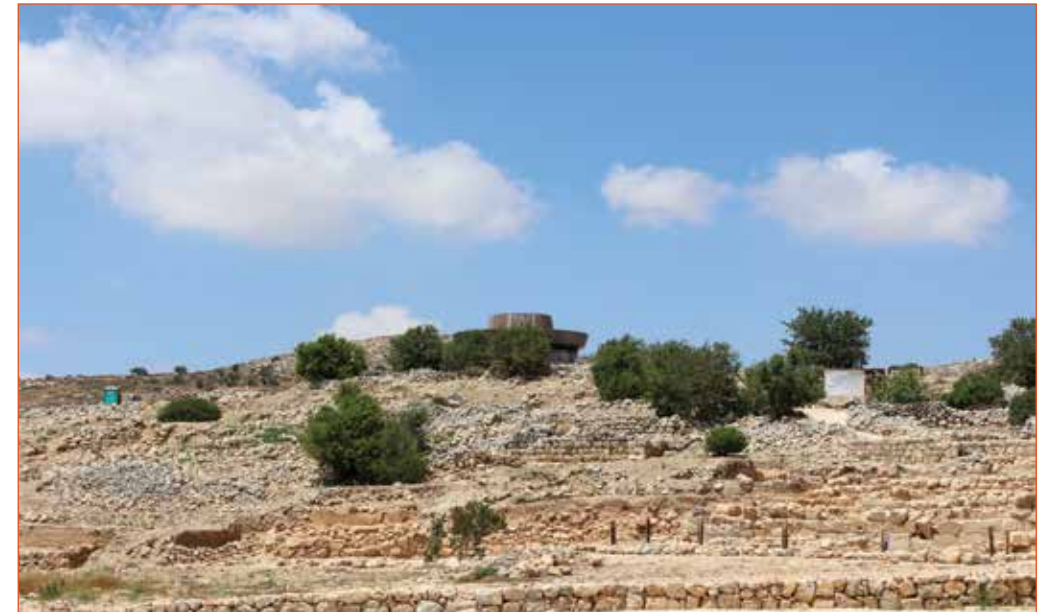
מבט לעבר לב התל המקראי

תל שילה שוכן על אדמות פלסטיניות, ועד ראשית שנות ה-80 למאה ה-20 התגוררו בשטחו משפחות מן הכפר קריות. התושבים פונו במקביל לחפירות הארכיאולוגיות שנערכו במקום על ידי מדינת ישראל. כיום הפלסטינים מנועים מלהגיע למקום ולעבד את אדמותיהם; מכיוון שהאתר הוא חלק מן ההתנחלות, תמיד אפשר למנוע את כניסתם לתל הארכיאולוגי בטענה שאין להם אישור כניסה לשטח ההתנחלות.