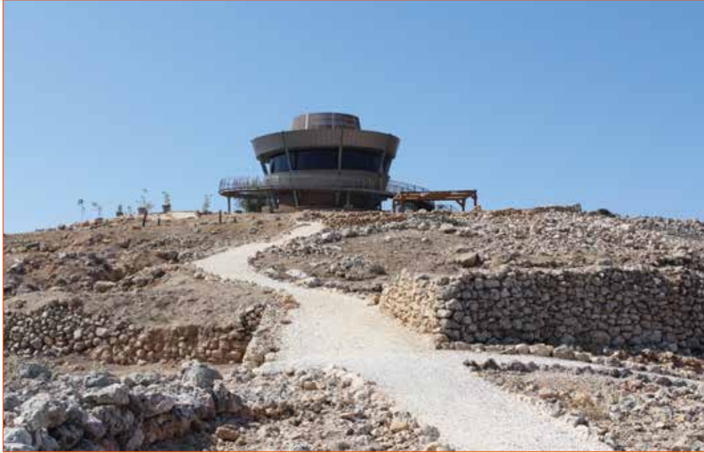
מגדל 'הרואה' הבנוי על התל הארכיאולוגי

בחלון התצוגה האחרון מצוינים שני אירועים: מלחמת ששת הימים בשנת 1967 והקמת התנחלות שילה בשנת 1978. כך נסגר המעגל, משילה הקדומה לשילה החדשה. הנרטיב והשפות (עברית ואנגלית) מכוונים לקהל יעד יהודי-מסורתי ונוצרי-דתי.