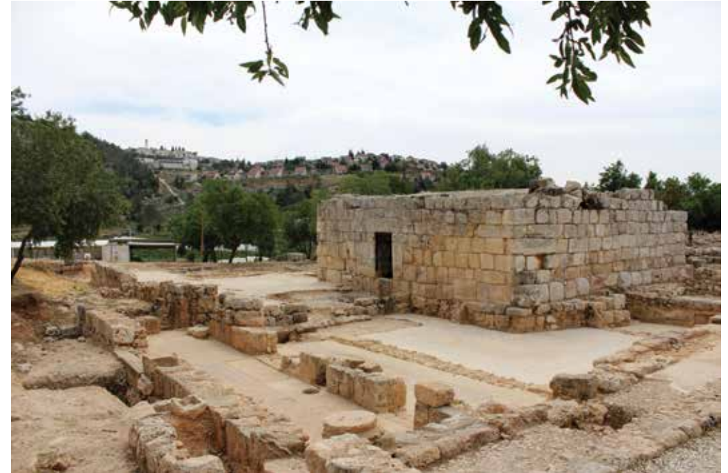
מסגד אל-יתים הבנוי על כניסה ביזנטית