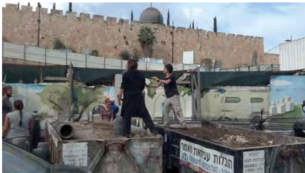
עבודות חפירה בחניון גבעתי

רשות העתיקות של מדינת ישראל, המופקדת בעיקר על שמירת נכסי העבר של ארצנו, נהנית מכוחו של ההון – הפוליטי והכלכלי – הנלווה למפעלי החפירה והבנייה באגן ההיסטורי של ירושלים. דגם הפעולה של "חניון גבעתי" לא שונה בהרבה מדגם הפעולה ברחבת הכותל ("בית הליבה") ובמנהרותיו. השותפות בין רשות העתיקות ואלע"ד ב"בניין ירושלים" קוברת תחתיה את השיח, המדע והזהות הישראלית, ומקימה על גבם ירושלים חד-ממדית, חד-לאומית ומסוכסכת.