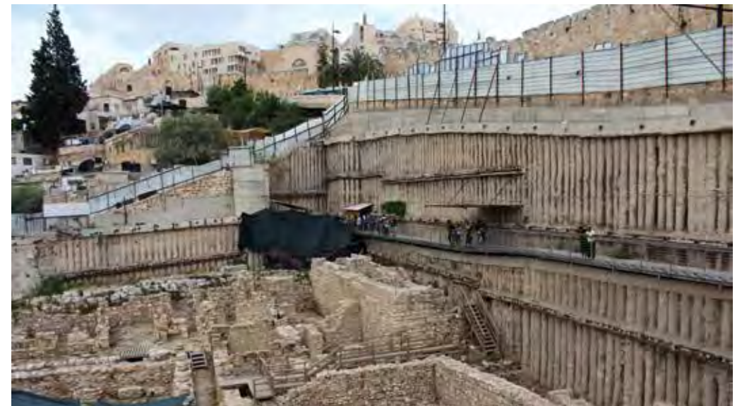
חפירות בחניון גבעתי - מבט למערב