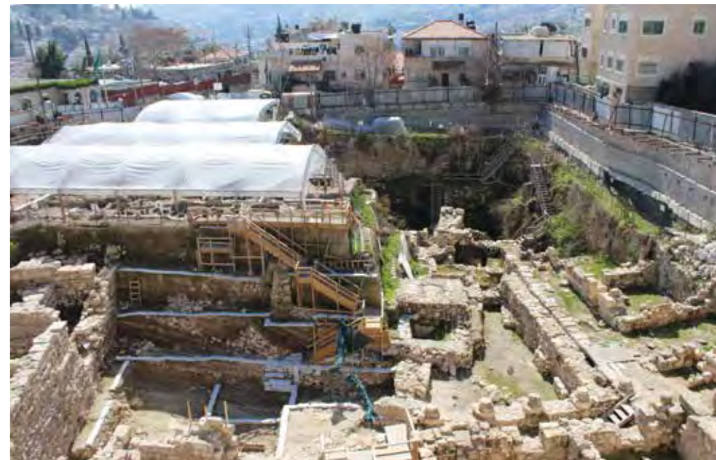
חפירות בחניון גבעתי - מבט לדרום

בתב"ע – מאושרת עקרונית על ידי רשות העתיקות, בעוד מעשה הבנייה עודנו כפוף להסכמתה ותלוי בהתקדמות השימור. אלא שבינתיים הולכים ומתמעטים השרידים המיועדים לשימור, כפי שנראה להלן, בפרק ג' בדו"ח.