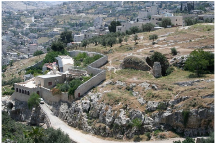
שרידי המבנה הצלבני לצד מגזר אונופריוס