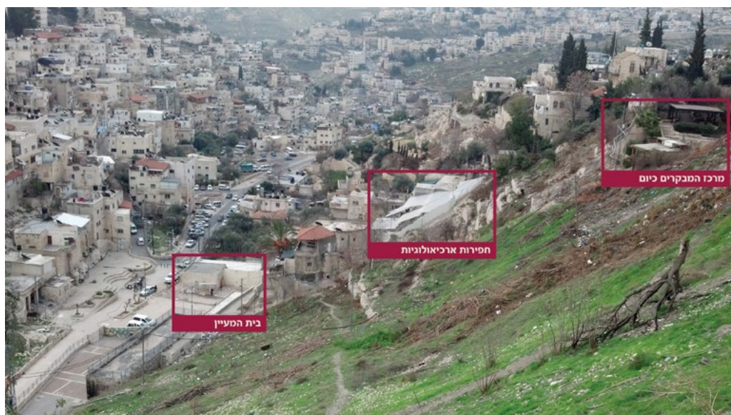
אתרי התיירות והחפירות במדרון המזרחי-צפוני של סילוואן/ואדי חילוה