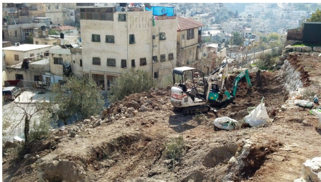
שטח חפירות אוניברסיטת ת"א