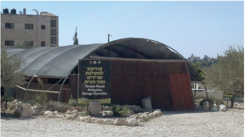
אוהל סינון העפר של עמותת אלע"ד

אחד האתרים הארכיאולוגיים היחידים שנחפרו בשטח הגן, הוא מערת כלי האבן המתוארכת לתקופת הבית השני ואשר נחשפה במהלך עבודות הפיתוח לסלילת כביש ירושלים-מעלה אדומים. המערה נחפרה בשנות ה-90 בידי רשות העתיקות. 31 מכיוון שהמערה ממוקמת לצד הכביש הבינעירוני, היא כמעט שאינה נגישה לציבור. האתר הארכיאולוגי המרכזי בשטח הגן הלאומי הוא 'ראס תמים', הנמצא במזרח שטח הגן, על אדמות הכפר עיסוויה. 32 בשלב זה, תוכניות הפיתוח של הגן אינן כוללות חפירה ארכיאולוגית באתר העתיקות, אולם מכיוון שזהו אתר העתיקות המרכזי בגן, ייתכן שבעתיד יהיה אתר זה חלק מרכזי במסלול התיירות.