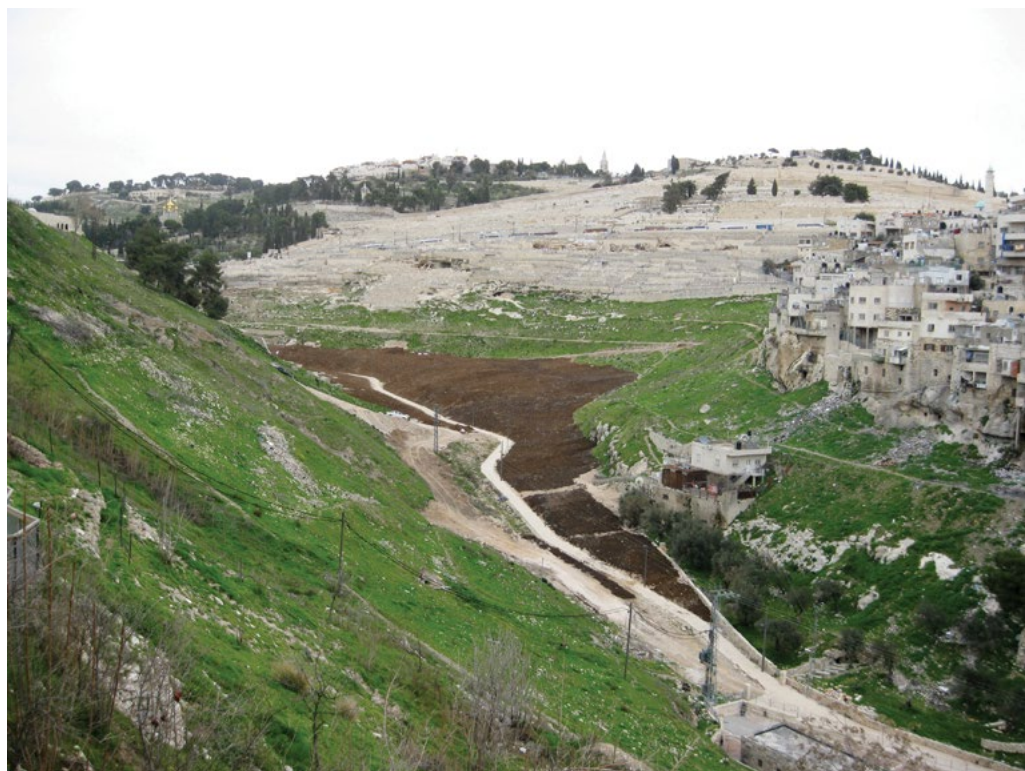
הכשרת טיילת הקדרון