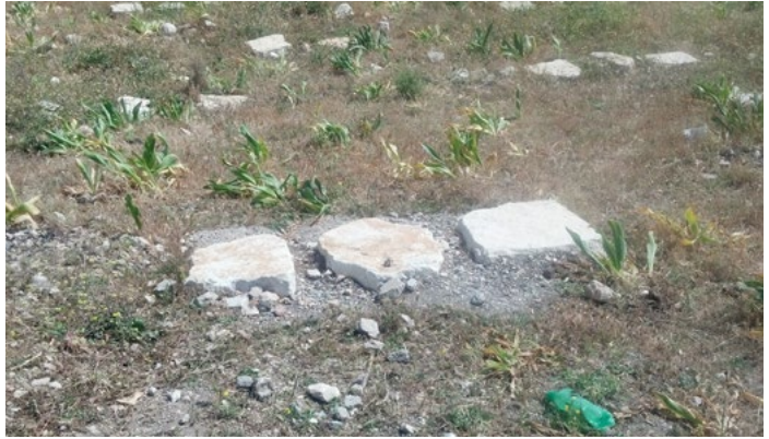
לוחות אבן קבועים בקרקע בבטון