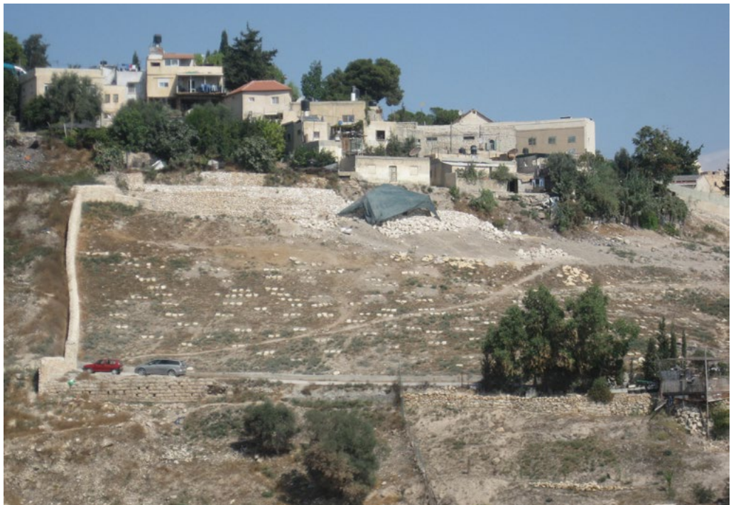
שיפוץ בית הקברות סמבוסקי בין בתי סילוואן