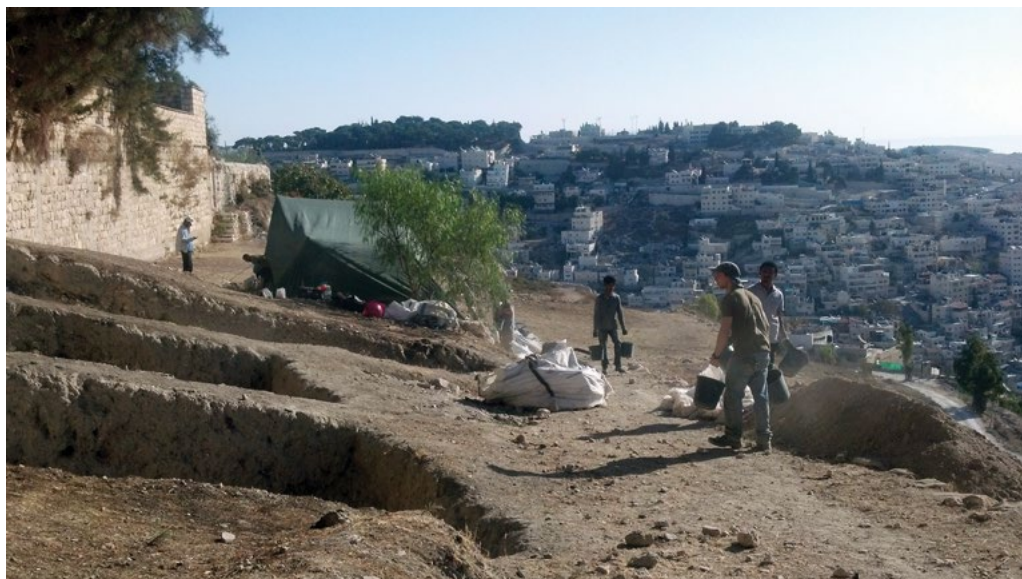
חפירה בהר ציון

במסמך זה אנו מתמקדים בפרויקטים הארכיאולוגיים הנערכים בגנים הלאומיים, במטרות החפירות ובעבודות השימור, ובזיקתם לעידוד ולביסוס האחיזה הישראלית בשטח שמסביב לעיר העתיקה - שטח שברובו נמצא מעבר לקו הירוק והוא חלק ממזרח ירושלים.