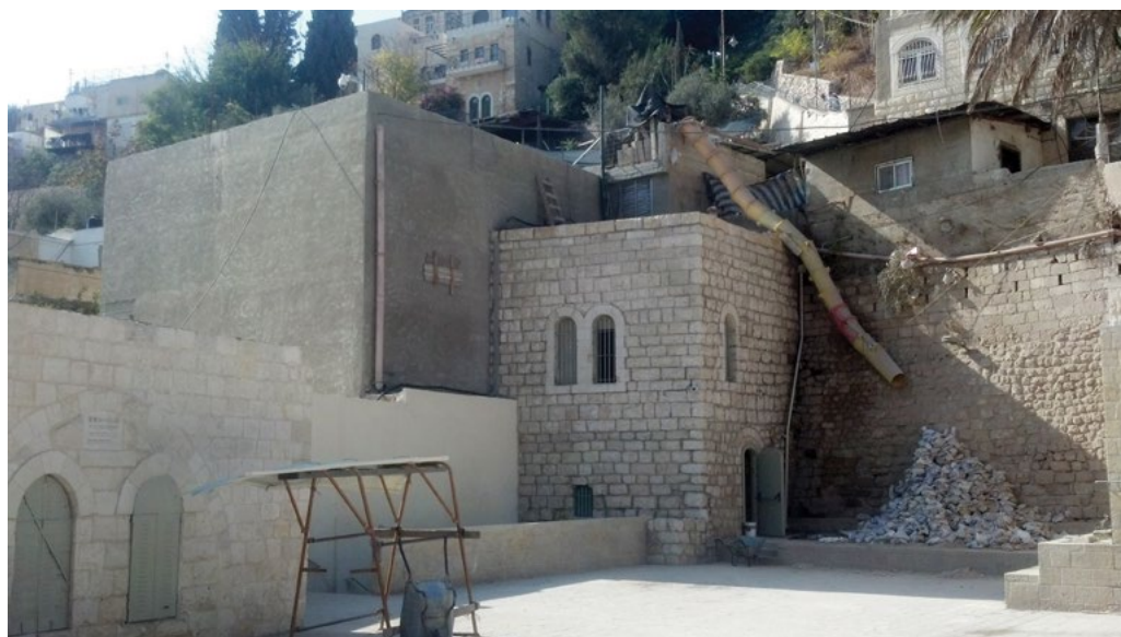
מתחם בית המעיין