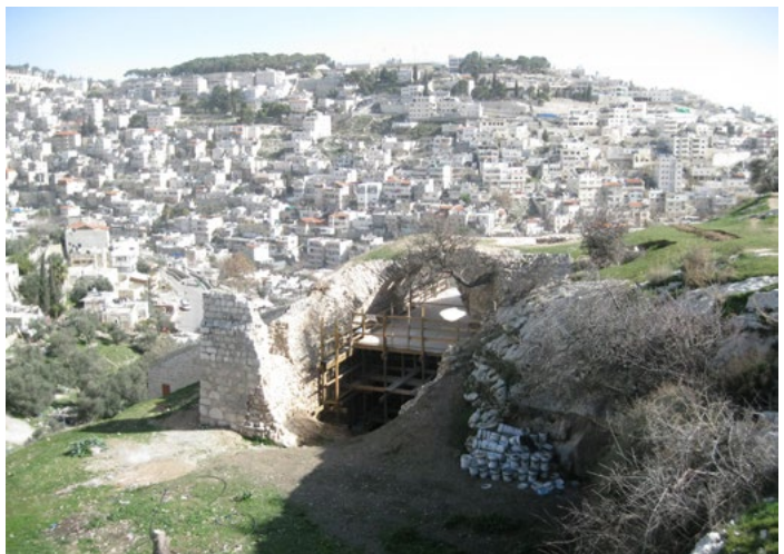
עבודות שימור למבנה הקבורה הצלבני ('בית העצמות')