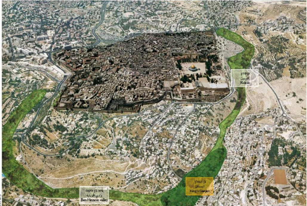
מיקום שכונת אל בוסתן 'גן המלך' בין גיא בן הינום לקדרון [מתוך תוכנית פיתוח גן המלך, הרשות לפיתוח ירושלים, 2 למרס, 2010]