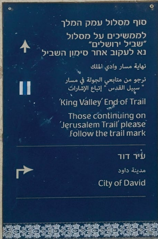
שלט בטיילת הקדרון