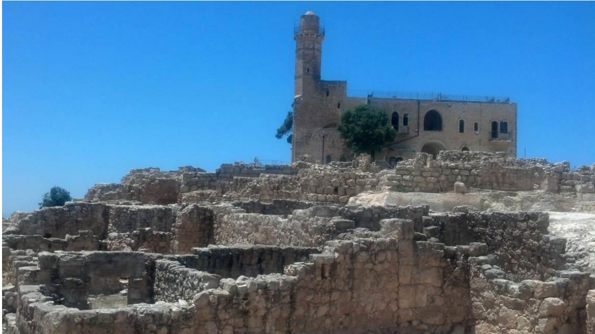
אתר העתיקות נבי סמואל והמסגד

גן לאומי נבי סמואל הוא אחד הגנים הגדולים ביותר בגדה המערבית. אתר העתיקות והמרכז הדתי הנמצאים בשטחו הפכו לכלי בחזית המאבק נגד תושבי הכפר הפלסטינים. כאשר רוב אדמות הכפר מוכרזות כגן לאומי וכפרם המקורי של התושבים נהרס והפך לאתר ארכיאולוגי, עתידו של הכפר בסכנה.