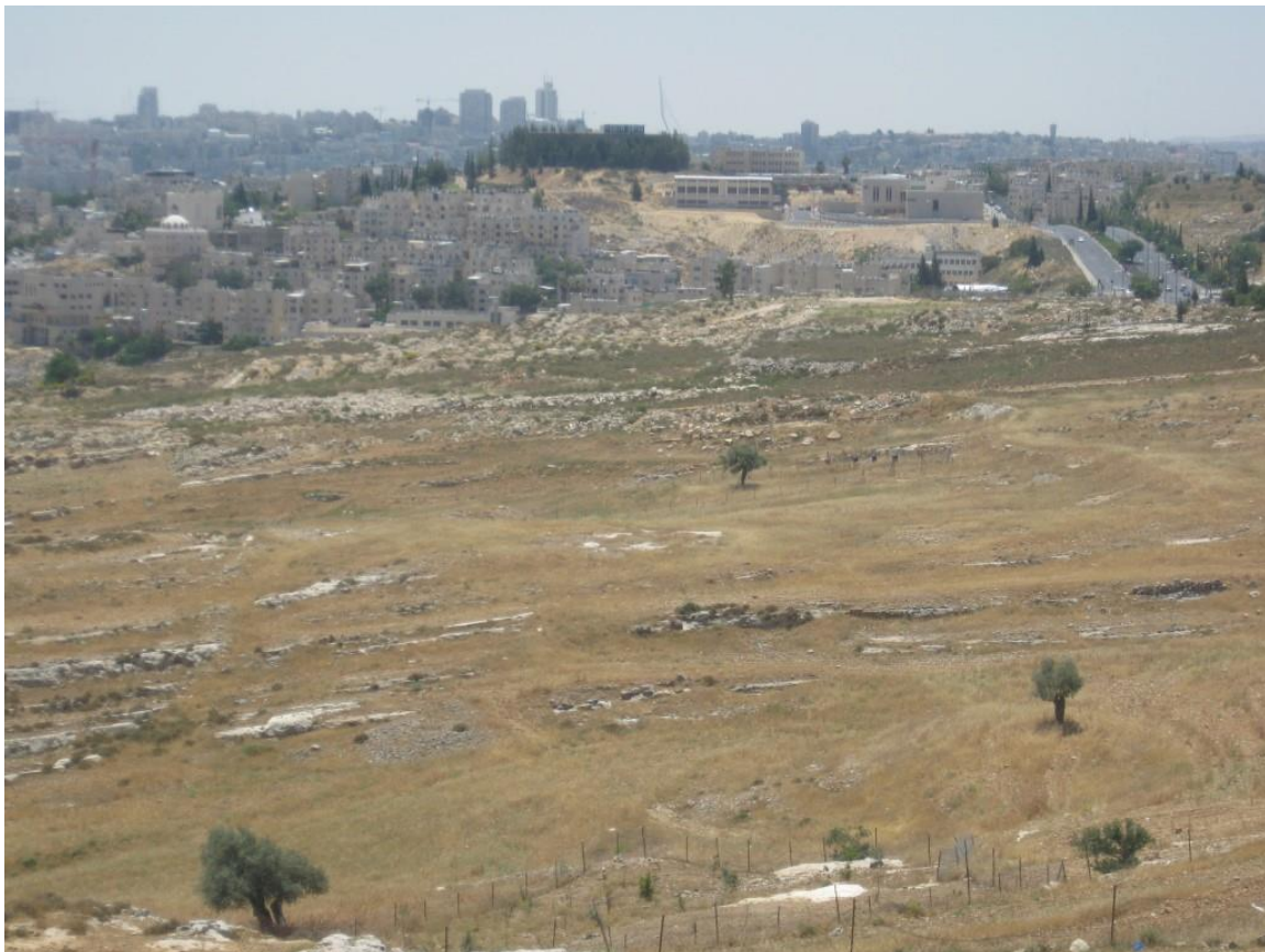
שטח הגן הלאומי הגובל בשכונה הירושלמית רמות

בעוד שצה"ל הרס את הכפר ביום אחד, החפירות מתרחשות לאיטן, תוך הצגתן כפעילות מדעית. הן מהוות נדבך חשוב בהפיכת המקום לאתר תיירות פעיל ומזמין. אפשר להניח שהכפר לא נהרס בגלל העתיקות, אלא מתוך שאיפה לשליטה אסטרטגית של צה"ל במקום גבוה הצופה על הגדה המערבית וצפון ירושלים. אך כיום, החפירות ואתר התיירות מונעים כל אפשרות של התושבים לחזור לכפרם.