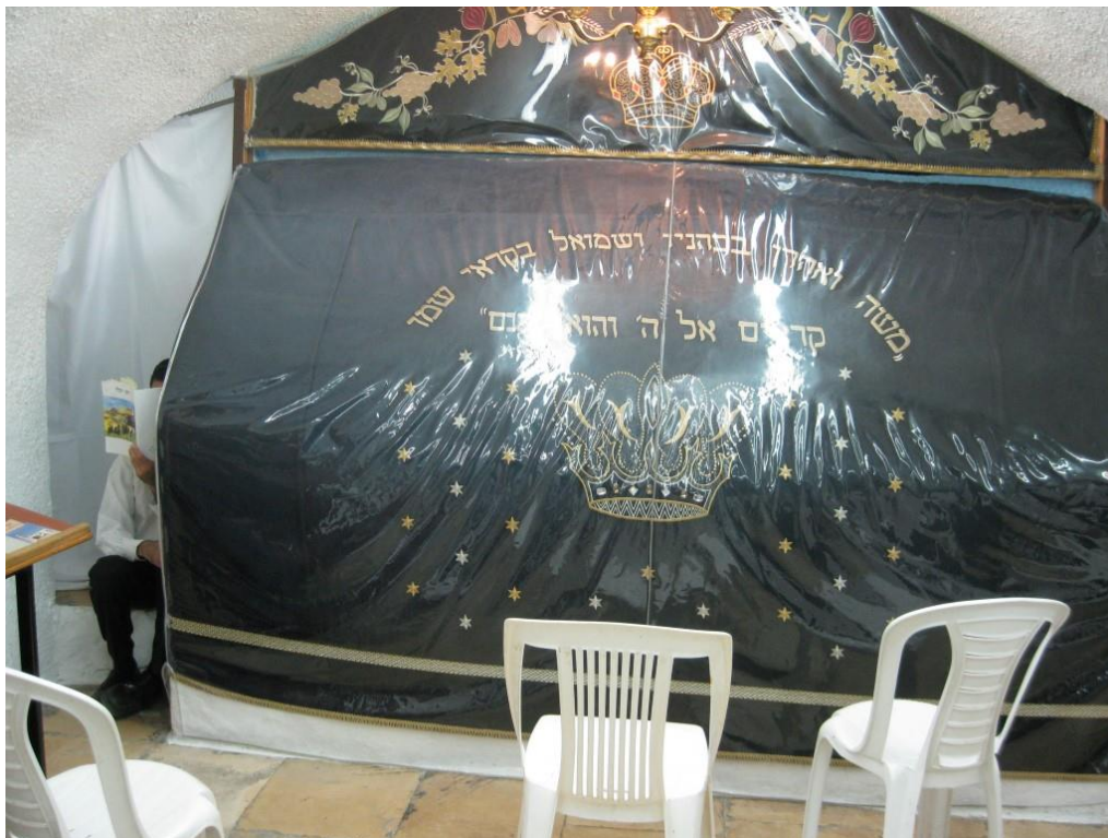
המבנה המזוהה כקבר שמואל הנביא

כיום קיים בקומת המרתף של בניין המסגד בית תפילה יהודי שבו הוקצה מקום נפרד לנשים. תפילת המוסלמים מתקיימת בקומת הכניסה. המסורת מזהה בקבר שמואל ובמעין הנובע בקרבתו, ונקרא מעין חנה, סגולה לנשים עקרות להיפקד בבנים.