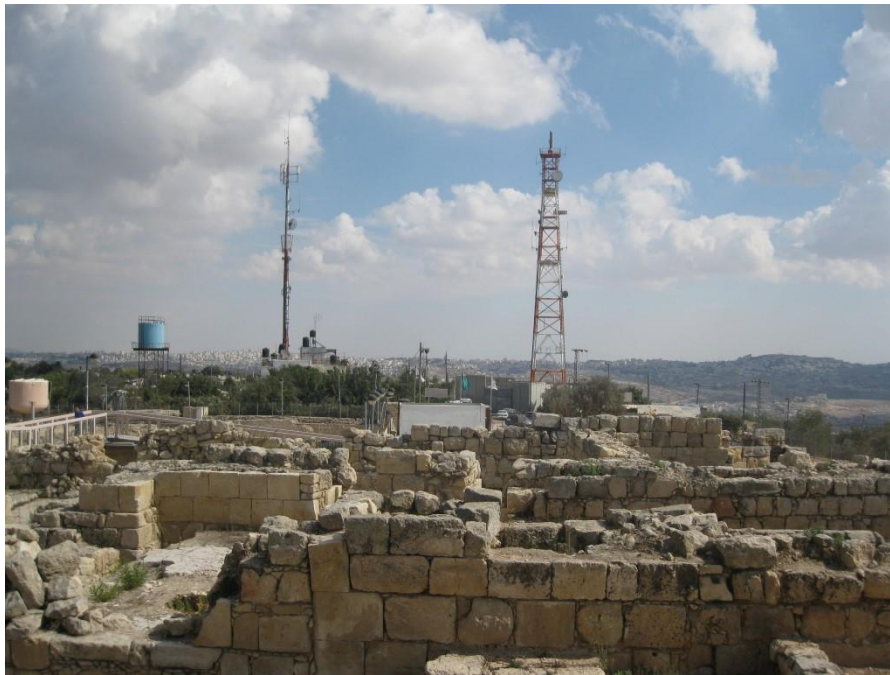
אנטנות הצבא ואחרות על רקע שרידי האתר

לצד המינהל האזרחי, האחראי על התושבים בשטחי C ובכללם על תושבי נבי סמואל, ההשפעה הישראלית המשמעותית ביותר על חיי התושבים היא ההכרזה שאדמותיהם הן גן לאומי (ראו פרק נפרד). בקצה הדרומי של הכפר מתגורר מתנחל ישראלי, הטוען לבעלות על חלק מהאדמות. התושבים מספרים על עימותים תמידיים ביניהם לבינו בכל פעם שמי מהם עובר במקום. 9 חומת ההפרדה, שנבנתה בשנים 2005/6 בחלקה בשטח הגן הלאומי, וחסמת הדרכים המובילות ישירות לכפרים בית איפסא ואל-גייב, מקשות עוד יותר על הקשר עם הגדה המערבית.