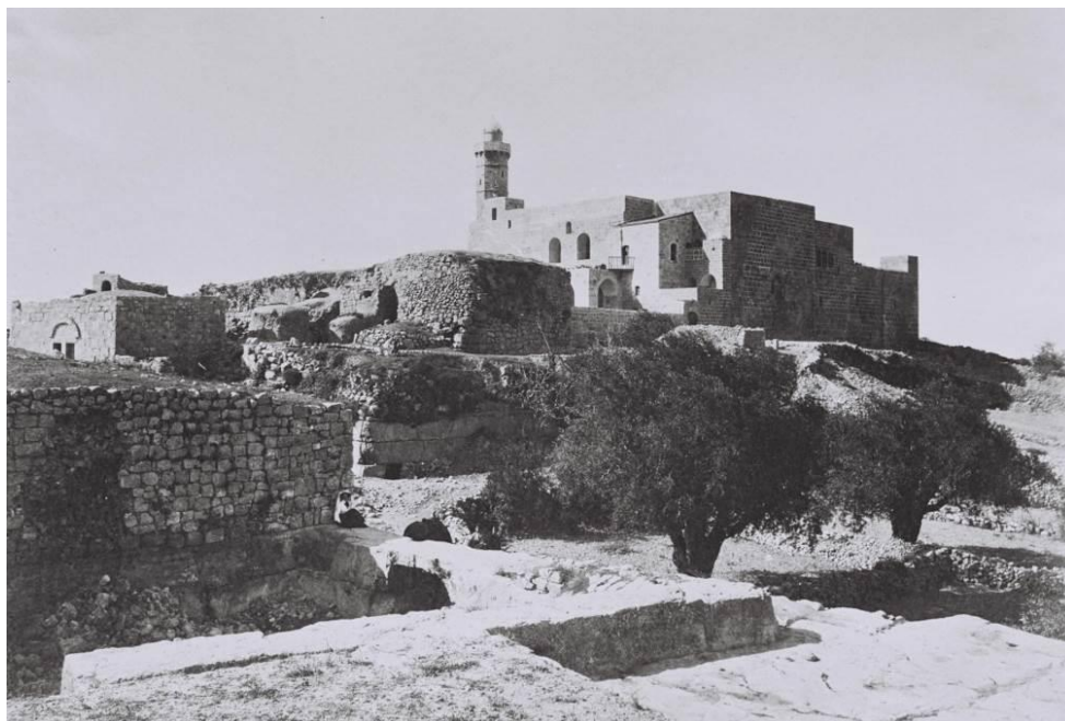
נבי סמואל – צילום משנת 1910