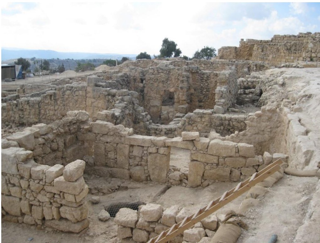
שרידים של בתי הכפר ושרידים קדומים יותר בגן הלאומי