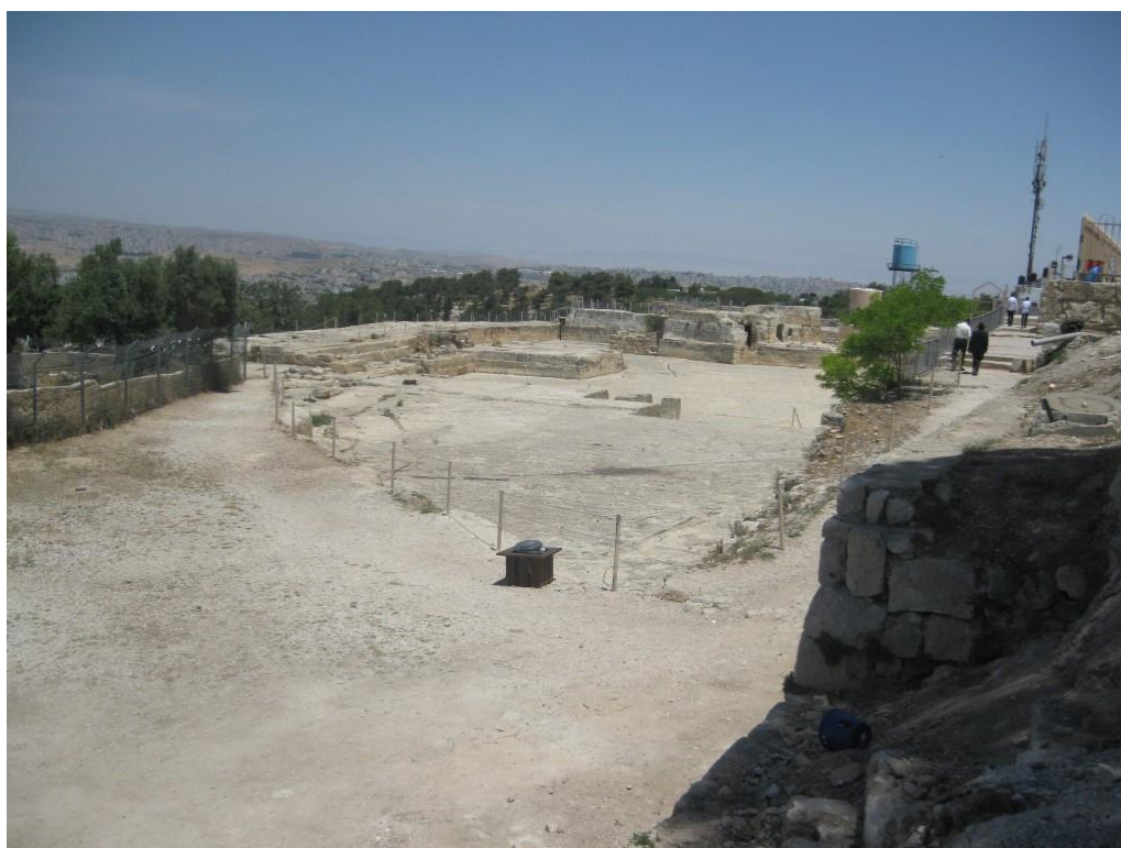
שטח אתר העתיקות שנחפר בשנות ה 90