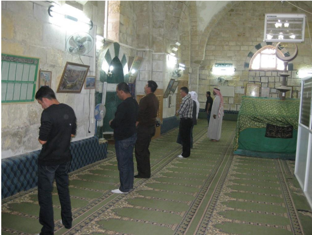
מתחם התפילה המוסלמי