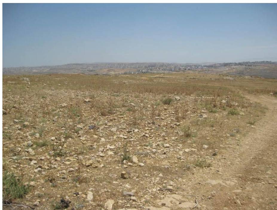
אדמות נבי סמואל המוכרזות כגן לאומי