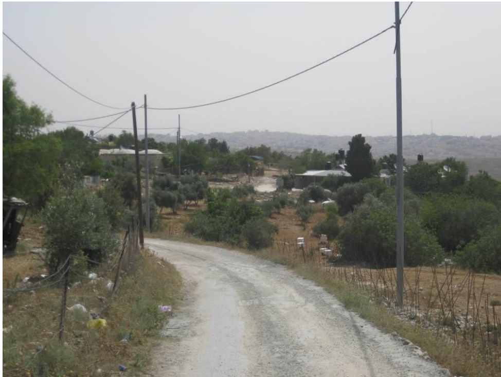
הכניסה לכפר נבי סמואל כיום