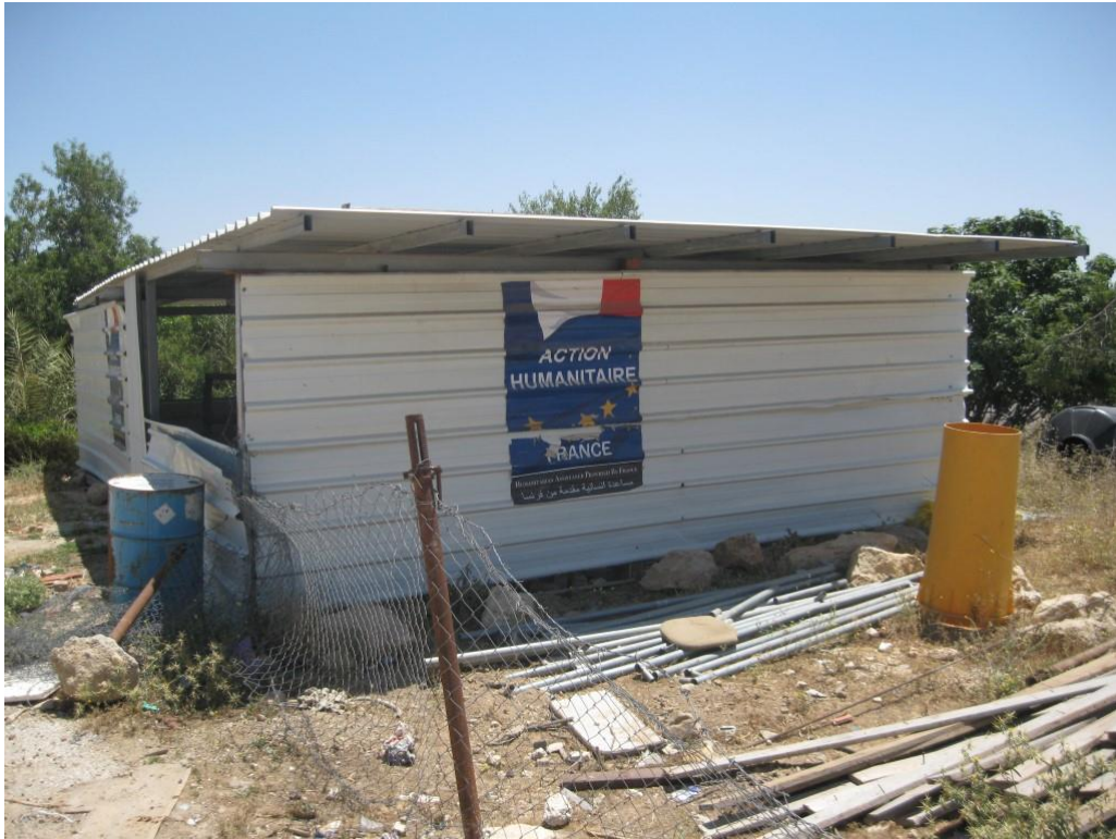
דיר עזים המיועד להריסה – תרומת ממשלת צרפת