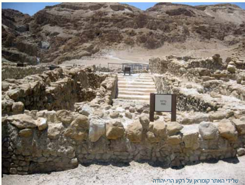
שרידי האתר קומראן על רקע הרי יהודה