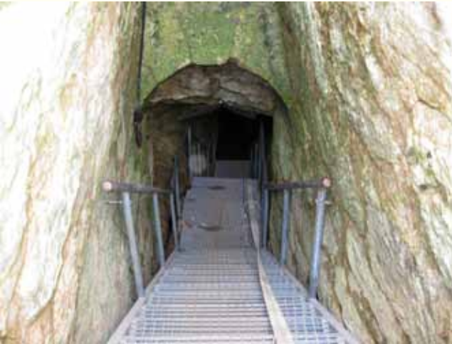
מדרגות המוליכות לאמת המים

ראשיתה של אמת הביאר בעין ביאר ואורכה כ-4.7 ק"מ; רובה היא מערכת מים חצובה בסלע העשויה מנהרות צרות ומקורות. האמה לא נחפרה עדיין, וההערכה שראשיתה במאה הראשונה לפנה"ס מסתמכת על מקורות היסטוריים וסקרים ארכיאולוגיים. היא הייתה בשימוש עד תקופת המנדט הבריטי. 25 אין אפשרות ללכת לכל אורכה, אולם המעין וקטע תת-קרקעי בן כ-100 מ' הוכשרו להליכה בימי הקיץ והסתיו. למרות אי הוודאות באשר לזמנה של האמה, היא מוצגת לציבור כאמה מהתקופה הרומית הקדומה המכונה גם ימי בית שני. מכל מקום, היא מוצגת לציבור כתוואי הולכת המים לירושלים ולבית המקדש ומשמשת להדגשת חשיבותו של האזור כולו כמקור החיים של ירושלים היהודית בימי תפארתה.