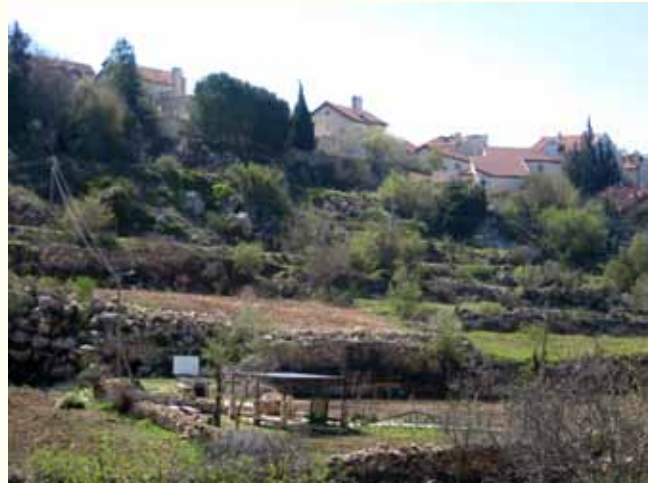
הכניסה לאמת הביאר למרגלות ההתנחלות אפרת