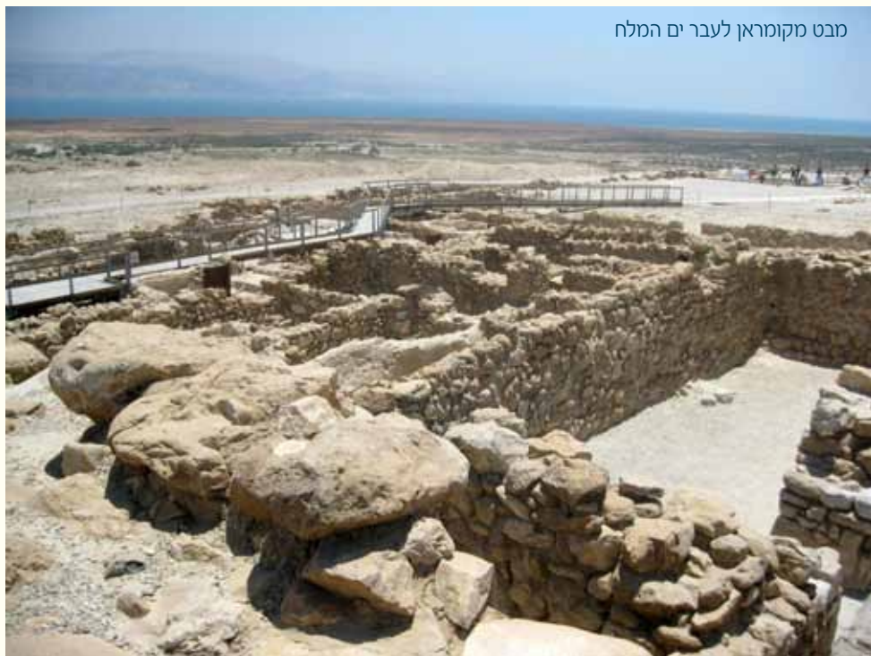
מבט מקומראן לעבר ים המלח