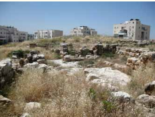
שרידים ארכיאולוגיים על רקע בתי מודיעין עילית

בתוכנית העבודה הראשונה של 'תשתיות מורשת לאומית' לשנת 2011 נכלל האתר חרבת בד-עיסא (בשמו הישראלי מודיעין עילית) ברשימת האתרים 'לשיקום והעצמה'. לשימור האתר ופיתוחו הוקצו כ-4 מיליון שקל והחלט על תוספת של מיליון שקל ממקורות נוספים. 24 העומדים בראש התוכנית רואים באתר זה אמצעי לקירוב הקהילה החרדית של מודיעין עילית למחקר הארכיאולוגי ולקשר שהוא חושף בינה לבין ההתיישבות היהודית הקדומה באזור. אנשי ההתנחלות מודיעין עילית, הגובלת בכפרים הפלסטינים בילעין ונעלין, רואים במאבקם בתושבי הכפרים הללו מאבק על זכותם לחיות בהתנחלות. הצגת האתר כישוב יהודי קדום מחזקת את הטענות הישראלי לזכות להתיישב על אדמות הכפרים.