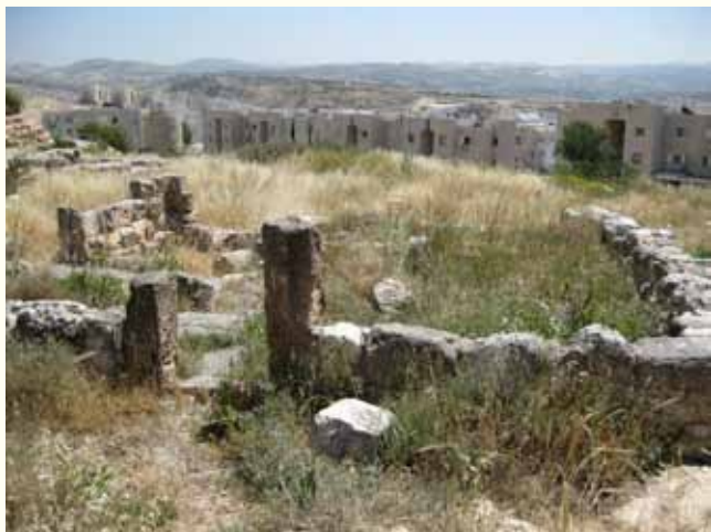
שרידי מבנה ציבורי המזוהה כבית כנסת