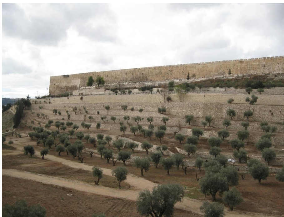
עמק הקדרון ממזרח לחומת העיר העתיקה – חלק מגן לאומי 'סובב חומות ירושלים'

שטחים רבים בגן מאוכלסים מזה עשרות שנים ויותר בתושבים, כדוגמת שכונת וואדי-חילוה בסילואן ולכן פעמים רבות צרכי הגן הלאומי: מניעת בניה, הרחבה לצרכי תיירות וכד', מתנגשים עם צרכי התושבים ומקשים על חיי היומיום. הגן הלאומי "סובב חומות ירושלים" הוא בעל חשיבות היסטורית וארכיאולוגית ראשונה במעלה, אך לא כך הוא בהכרח המקרה של שני הגנים הלאומיים האחרים.