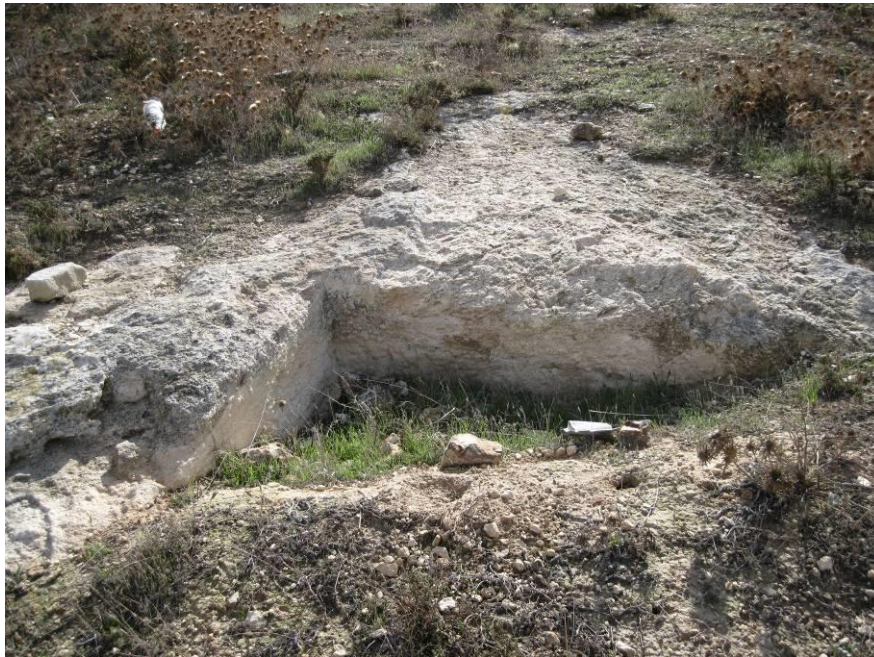
סימני חציבה באבן – אתר עתיקות על פי הגדרה

לצורך הכשרת השטח כגן לאומי נתבקשה רשות העתיקות לבצע סקר ארכיאולוגי שיעמוד על חשיבות המקום מבחינה ארכיאולוגית. הסקר של רשות העתיקות מציין שהמדרון שימש לקבורה בתקופה הרומית והביזנטית, במקום נחשפו שרידים שונים של מתקנים חקלאיים ומחצבות. הסקר נערך גם בגבעה הנמצאת בשטח הכפר עיסאווייה מצפון לכביש ירושלים - מעלה אדומים ומכונה ראס-תמים. באזור זה נמצאו מספר מתקנים חקלאיים וחרסים המעידים על נוכחות אנושית בעבר, אולם לא נחשפו שרידים ארכיאולוגיים המעידים בברור על אתר קדום במקום. 9