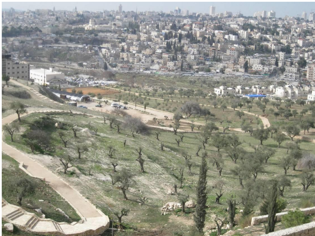
עמק צורים – מבט ממזרח למערב

רצועת גנים החובקת את חומות ירושלים. בעקרונות התכנון מצוין שהגן מתחבר לטיילת הר הצופים, משחזר את נקודת התצפית של עולי הרגל בתקופות קדומות, ואת נוף התרבות החקלאית של ספר המדבר. 4