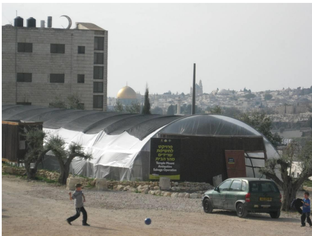
אוהל פרויקט 'סינון עפר מהר הבית' ב'עמק צורים'

בשטח החפירה. במיזם זה, שנועד לחשוף שרידים מבית המקדש או שרידים יהודים חשובים אחרים, ניברר יחסית מעט מאוד חומר, ואין הוא מספק מידע אמין על עוצמת ההרס בהר הבית. זוהי דוגמה למיזם המשלב דאגה לעתיקות עם שיקולים דתיים, לאומיים ופוליטיים. 6 פרויקט הסינון הוא גורם מרכזי להגעת מבקרים ל'עמק צורים'. תנועת מבקרים ישראלים המגיעים לסינון עפר הר הבית מחזקת את הנוכחות הישראלית במזרח ירושלים.