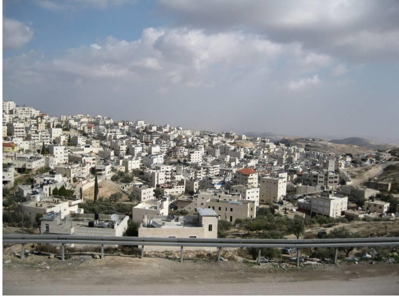
הכפר הפלסטיני עיסאווייה