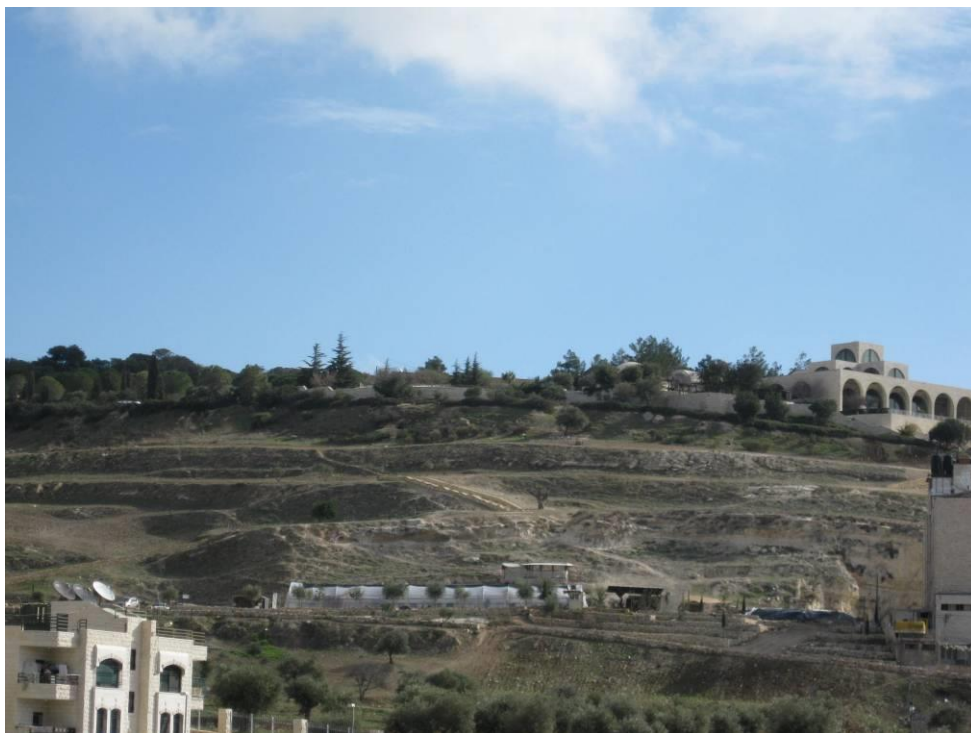
עמק צורים ואוהל פרויקט 'סינון העפר מהר הבית'

של הטרסות החקלאיות. יש קושי רב לתארך את מועד בנייתה של טרסה ולכן הדעות חלוקות לגבי זמן בנייתן. ההנחה המקובלת טוענת שרוב הטרסות הן בנות מאות שנים לכל היותר. 7 למרות ההסכמה בקרב החוקרים שהרוב המכריע של הטרסות החקלאיות אינן בנות אלפי שנים ואינן שריד של נוף האבות, נדמה שהציבור נוטה לזהותן ככאלה וכחלק מהמורשת היהודית או הישראלית. המיקום של הגן בקרבת העיר העתיקה והזיהוי המוטעה של הנוף המקומי כנוף אבות קדמוני, מהוות סיבות מרכזיות בהכרזה על עמק צורים כגן לאומי וקבלתו בציבור כבעל חשיבות היסטורית. אנו משוכנעים שנוף הטרסות ועצי הזית, שרובם ניטעו בשנים האחרונות, אינו מצדיק הכרזת גן לאומי בשטח המכונה 'עמק צורים'.