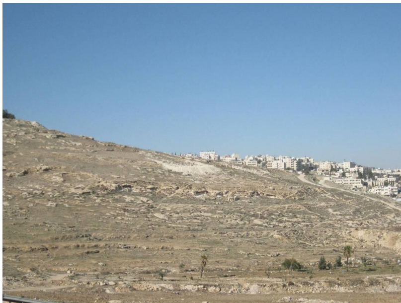
מבט מהכפר א-טור לעבר עיסאווייה

הסקר הארכיאולוגי שנעשה לבקשת רשות הטבע והגנים על ידי רשות העתיקות, בשטח הגן הלאומי המיועד, מחזק את הערכתנו שאין בממצאים המוכרים בשטח סיבה לקדם את המקום כגן לאומי. נראה שהחלטה לנכס את השטח כגן לאומי נובעת משיקולים פוליטיים; לאפשר רצף טריטוריאלי ללא אוכלוסיה פלסטינית, מן העיר העתיקה של ירושלים, דרך גן לאומי 'עמק צורים' לעבר הטיילת של הר הצופים (שאינה מוכרזת גן לאומי) ולשטח של מורדות המזרחיים של הר הצופים עד לקרבת השטח המכונה 1E. רצף כזה, יאפשר את חיבורה של ירושלים להתנחלויות ממזרח, בשטח לא מיושב בפלסטינים ויחצוץ בין דרום הגדה המערבית לצפונה.