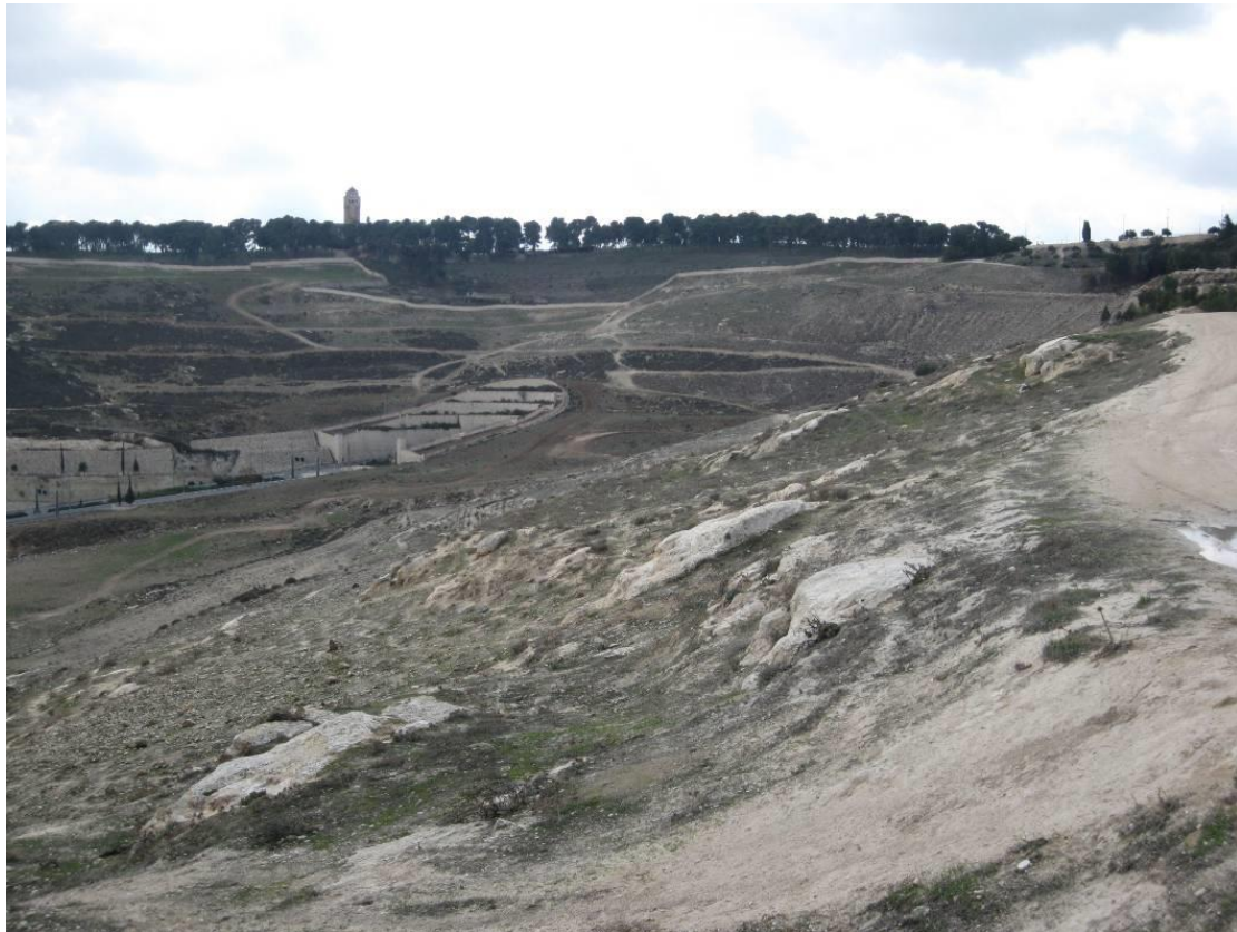
השטח המיועד לגן הלאומי – מבט מעיסאווייה לעבר א-טור והר הצופים

או : גנים לאומיים מאזור העיר העתיקה של ירושלים ועד לאזור E1