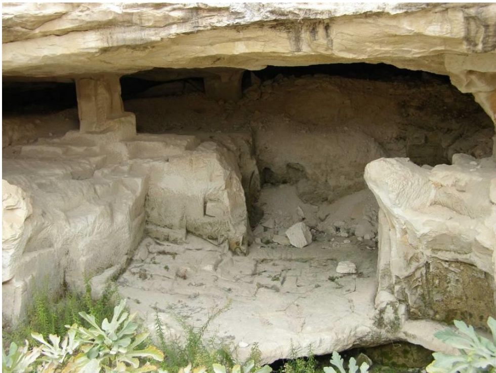
מערה לחציבת אבנים והכנת כלי אבן

(ח'יאן) בתקופה המוסלמית הקדומה (מאה 7-8 לספירה). 12 והנה, חשיפתם של האתרים הללו לא מנעה את סלילתו של הכביש למעלה אדומים.