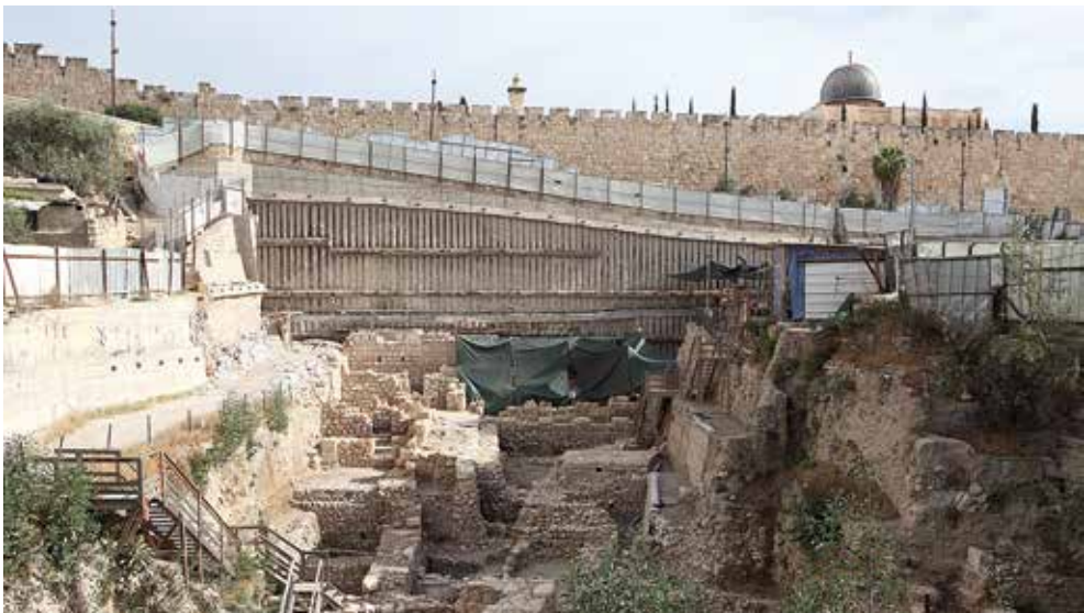
חפירות גבעתי על רקע אל-אקצא

דיון נרחב באופן שימורם של שרידי עתיקות בעיר העתיקה של ירושלים יכול לחזק את ההכרה בזכותם של מיעוטים ובעלי עניין שדעתם אינה נשמעת, לא רק בתחום שימור של העיר, אלא גם בהיותם שותפים שווים זכויות בה. נראה שבטווח הארוך לא יהיה מנוס מבחינה מחודשת של אופן הצגתם של אתרי העתיקות ושטחי החפירה באגן ההיסטורי, והבנה שלצד הרצון לחשוף ולחפור יש להתחשב גם בצורכיהם של התושבים ובאינטרסים של בעלי עניין אחרים. וכך, למרות שמסמך זה עוסק בשימור העתיקות של האגן ההיסטורי, להיבטיו של תחום זה נודעת השפעה מכרעת על עתיד האגן ההיסטורי והסיכוי לפתרון פוליטי שיהיה מקובל על כל הצדדים.