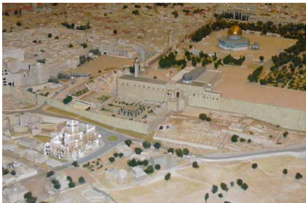
תוכנית 'מתחם קדם'