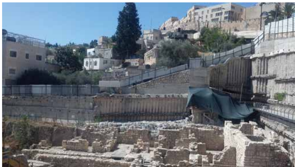
חניון גבעתי על רקע הכפר, מבט למערב