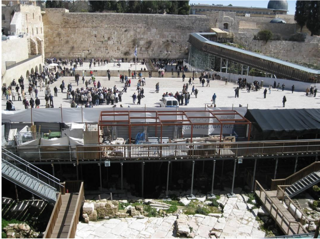
מבט על מערב רחבת הכותל – בקדמת התמונה עתיד לקום 'בית ליבה'

בתחילת פברואר הופקדה להתנגדויות בוועדה המחוזית לתכנון ובניה, תכנית בנייה בחלקה המערבי של רחבת הכותל המערבי. את התכנית מקדמת הקרן למורשת הכותל האחראית על רחבת הכותל ועל מנהרות והכותל. המבנה מכונה 'בית הליבה' ומיועד להכיל כ-3,700 מ"ר הבנויים לגובה שלוש קומות מעל פני הקרקע וקומה וחצי מתחת לפני הקרקע. המבנה המתוכנן יעמוד מול מתחם הר הבית-חארם אל שריף.