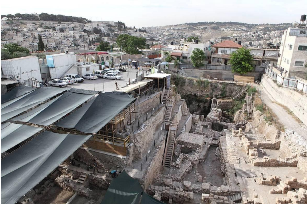
חפירות חניון גבעתי על רקע בתי הכפר סילוואן

משך שנות החפירה פורסמו בתקשורת פרסומים על ממצאים יוצאי דופן בחפירה, החל באוצר הגדול ביותר של מטבעות זהב מהתקופה הביזנטית 1 ועד למבנה מתקופת בית שני שהוצע לזהותו בתור ארמון הלני המלכה. 2 פרסומים אלו ואחרים יצרו עניין ציבורי בחפירה הארכיאולוגית ובממצאיה. בעבור רבים, הגילויים והפרסומים האקדמאים היוו ראיה שאין מדובר בחפירה ארכיאולוגית שמשלבת אינטרסים פוליטיים. במובן הזה, אמירותיה של רשות העתיקות שאינה עוסקת בפוליטיקה, אלא אך ורק בארכיאולוגיה זוכות, לאוזניים קשובות.