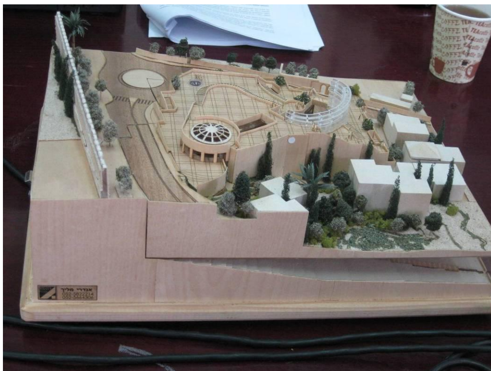
דגם הבניין המתוכנן בחניון גבעתי כפי שהוצג בוועדה המחוזית

יהיה צורך לחפור לעומק, אלא להתחיל בבנייה מיד. 2. הציבור תפסו את החפירה בתור חפירה ארכיאולוגית מדעית, והתעלמו מהשימוש בחפירה לקידום המטרות הפוליטיות של עמותת אלע"ד ושל גורמים ממשלתיים אחרים. כך, אף שהחפירה הייתה חלק מבניית תשתית להתנחלות במזרח ירושלים, נדמה שהרשויות והמתנחלים הצליחו להציגה בתור חפירה ארכיאולוגית בלבד 3. הממצא הארכיאולוגי לא רק מנע התנגדות, אלא אף יצר בציבור אהדה ותמיכה בחפירה.