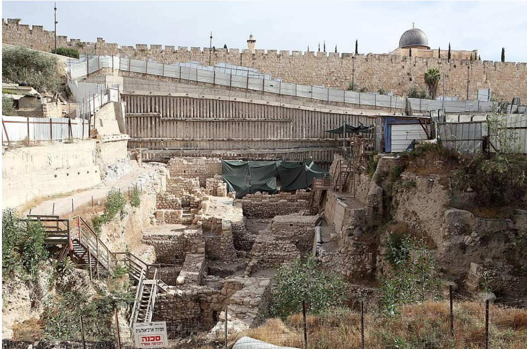
חפירות חניון גבעתי על רקע מסגד אל-אקצא וחומת העיר העתיקה