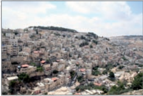
סילואן במבט מהתן הלאומי