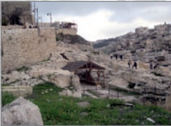
מבט לצפון: חפירות וייל, בית רוזקן ובתי הכפר