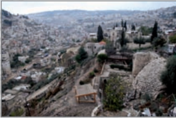
מבט על האתר הארכיאולוגי והכפר סילוואן