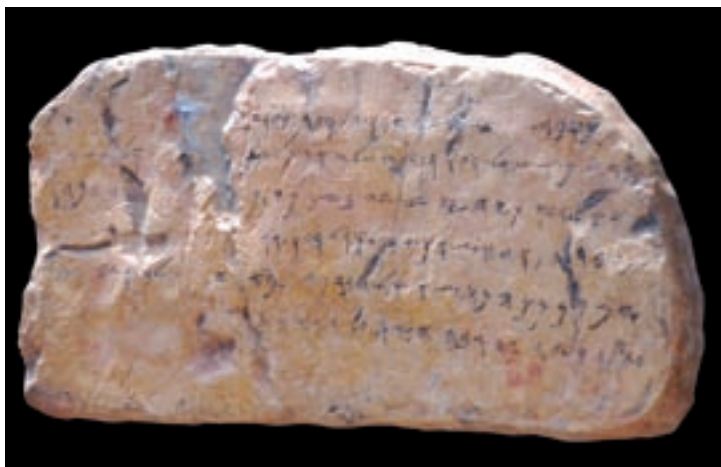
כתובת נקבת השילוח (העתק)

החיים בימי ממלכת יהודה. המבקר ייחשף לסיפור שהמקרא אינו מספק: היכן וכיצד חיו תושבי העיר, היכן שכנו בני המעמד השליט והיכן שכנו בני המעמד הנמוך, מה הממצא הארכיאולוגי מלמד אותנו על אורח חייהם, מה ידוע לנו על מנהגי המקום, אילו אמונות עממיות רווחו על-פי הממצא הארכיאולוגי ועוד.