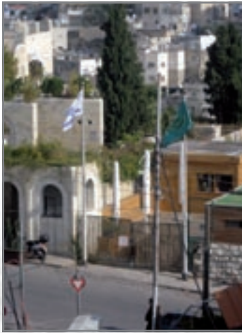
דגל רשות הטבע והגנים בכניסה למרכז המבקרים