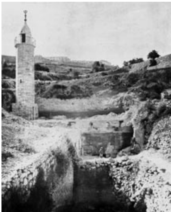
בריכת השילוח, 1909

את התיירות על חשבון צורכי הכפר ורווחתו ניתן לראות בתוכנית של עיריית ירושלים להפקיע אדמות פרטיות לטובת שטחי חניה. זאת, בכפר הסובל ממחסור בבתים-ספר, גני ילדים, גני משחקים, סניף דואר, מרפאה ושירותים רבים אחרים. התחשבות בצורכי התושבים היתה מביאה את העירייה להסב את ייעוד האדמות המופקעות לקידום רווחתם על פני קידום התיירות באזור.