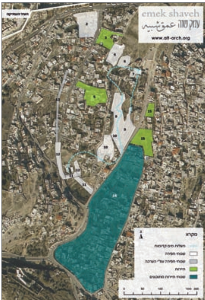
מפת סילוואן/ירושלים הקדומה (עיר דוד)