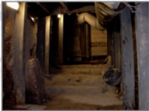
חפירת מנהרה בעקבות גילוי הרחוב ההרודיאני