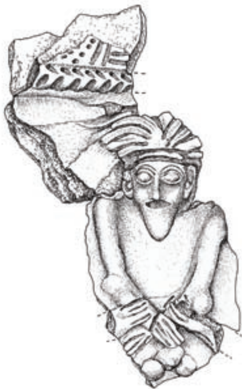
איור שבר של כן פולחני שנמצא בחפירות משלחת עיר דוד, מאה 11-10 לפנה"ס(?)