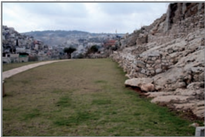
שטח E : מוכשר כגן אירועים