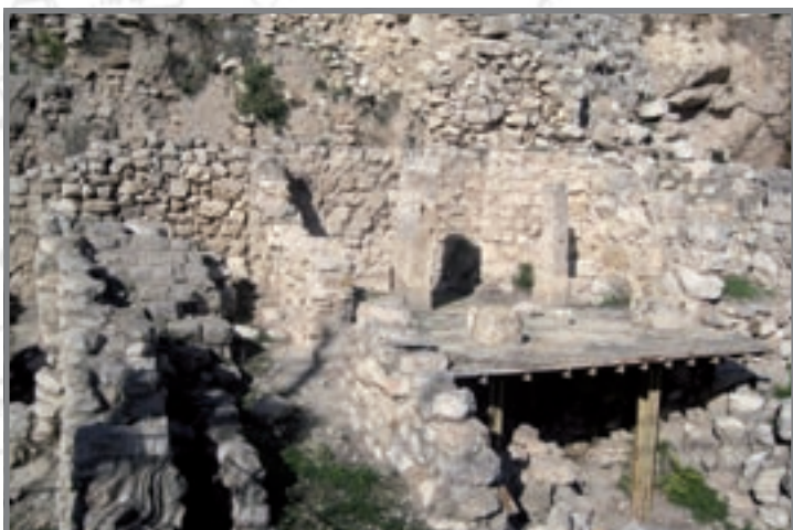
שטח G - בית ארבעה מרחבים