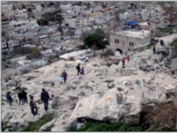
שטח החפירות של וייל ובית מיוחס