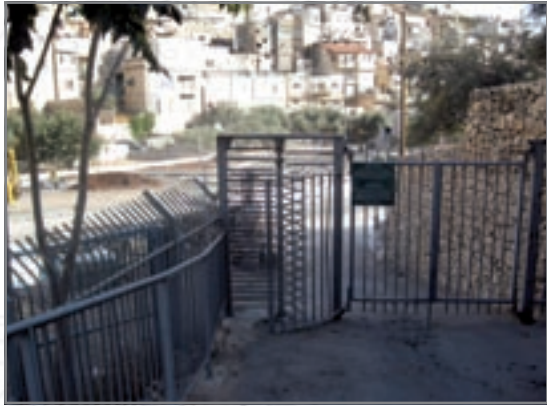
היציאה משטח E לכיוון שכונת הבוסתן