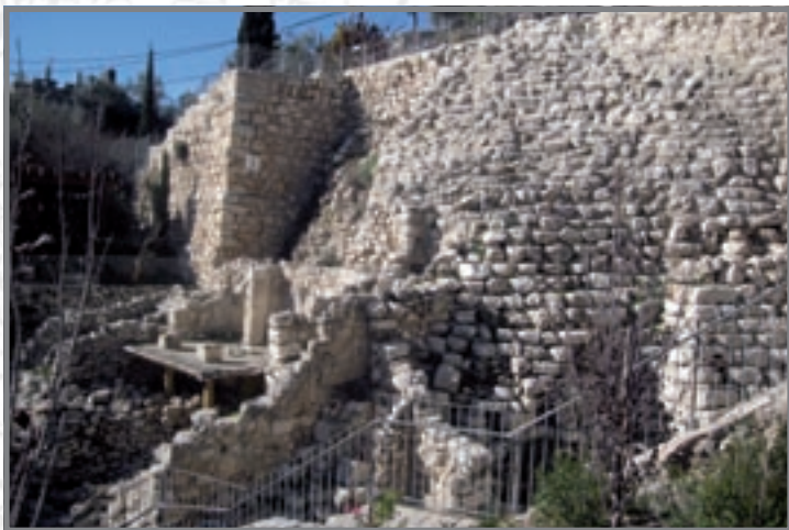
מבט מקרוב על שטח החפירות G