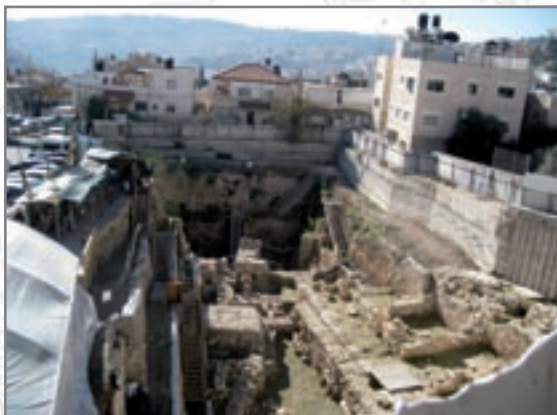
חפירות חינוך גבעתי