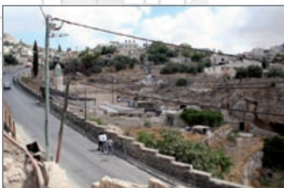
הכביש הראשי בסילוואן. המדרכה המוגדרת ושטח החפירה הצמוד למסד