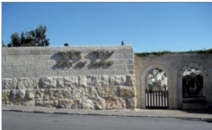
הכניסה למרכז המבקרים עיר דוד

כאשר הארכיאולוג חובר ליוזם המממן את החפירה ואינו בדיאלוג עם שאר הכוחות הפוליטיים במקום, הוא מחזק את הזיהוי שלו עם הגוף המממן.