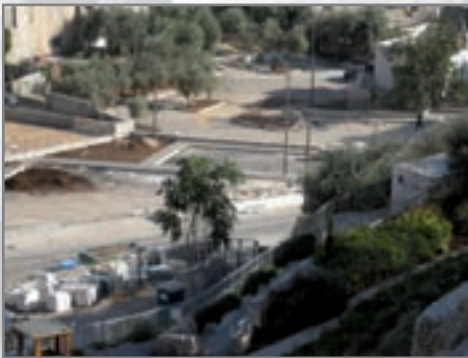
פיתוח חניונים בשטח שכונת אל-בוסתן