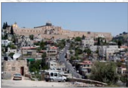
סילואן - מבט לעבר העיר העתיקה