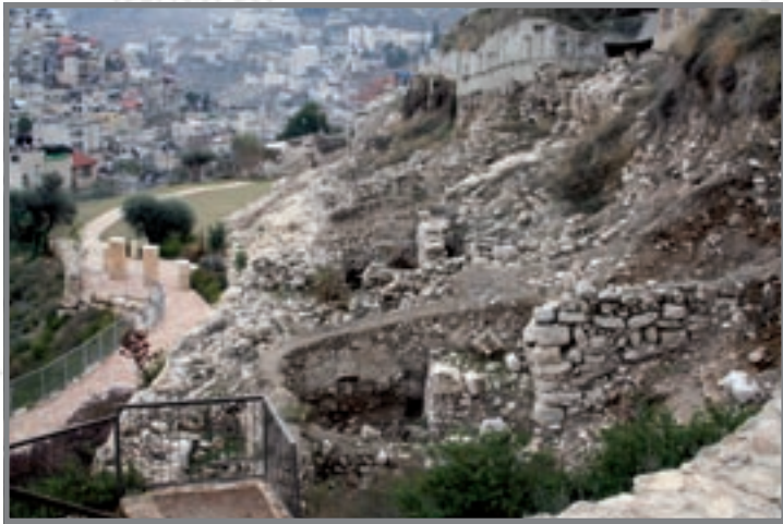
מבט על שטח החפירות E